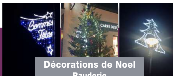
Décorations de Noël Rauderie