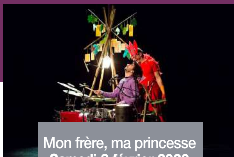
Mon frère, ma princesse Samedi 8 février 2020 20h30