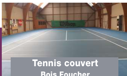
Tennis couvert Bois Foucher Sol