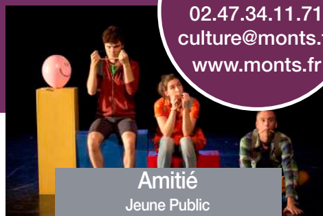
Amitié Jeune Public Mardi 18 février 2020 15h00

RÉSERVATION Service Culturel 02.47.34.11.71 culture@monts.fr www.monts.fr