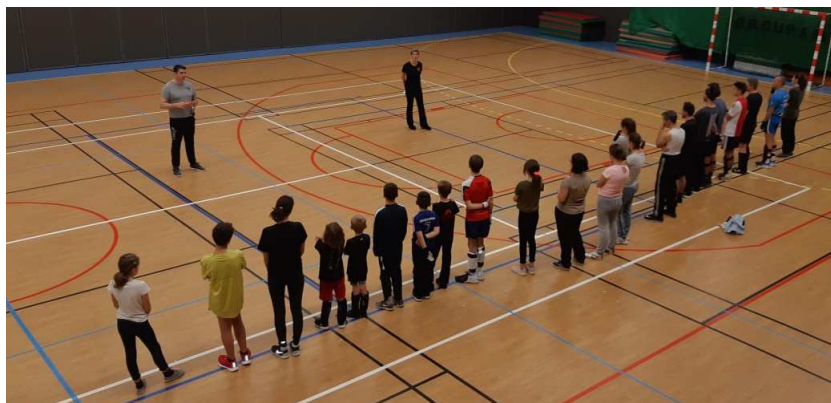
Le salut en ligne enfants et adultes.

Le Tennis de Table du Périgord Vert, entente Brantôme-Champagnac de Belair, se porte à merveille.