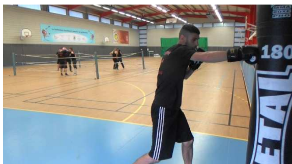
Entraînement au sac et dans le ring.

N'hésitez pas à venir nous rendre visite, jouer et transpirer avec nous !