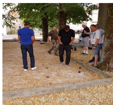
14 juillet 2019 - pique-nique