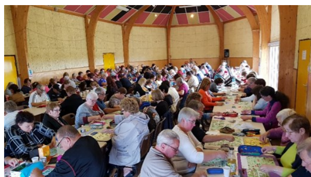
8 septembre 2019 - loto