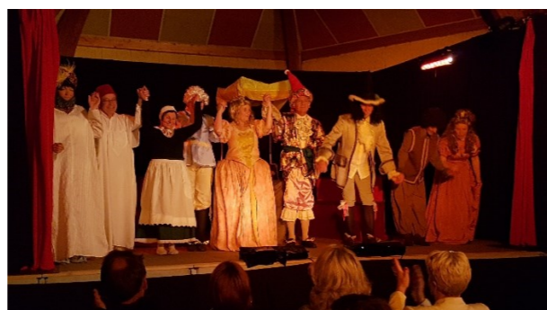
18 mai 2019 - théâtre de Souppes