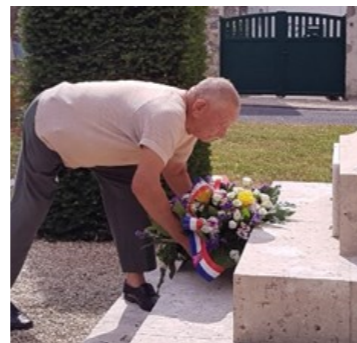
14 juillet 2019 - commémoration