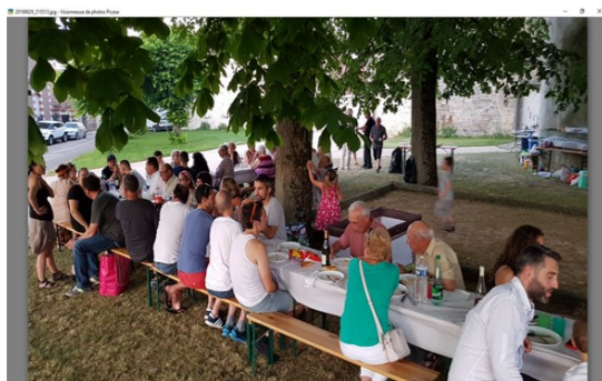
29 juin 2019 - fête des voisins