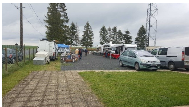
8 mai 2019 - vide-grenier et expo artisanale