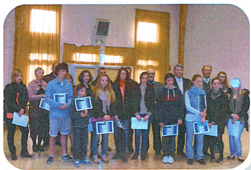
Les Lauréats des 4 communes 2011