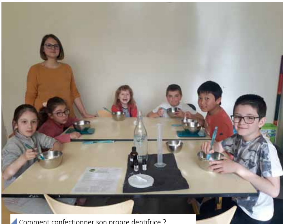
Comment confectionner son propre dentifrice ? Les enfants de l'accueil de loisirs connaissent la réponse.