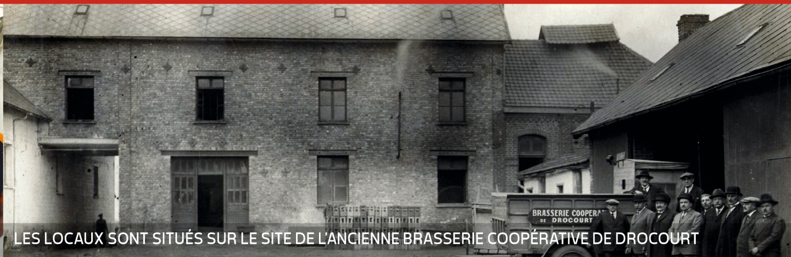
LES LOCAUX SONT SITUÉS SUR LE SITE DE L'ANCIENNE BRASSERIE COOPÉRATIVE DE DROCOURT