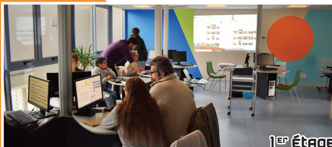
1 er Étage