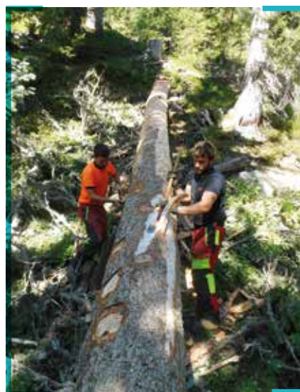
Subvention Département à 100%