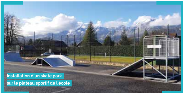
Installation d'un skate park sur le plateau sportif de l'école