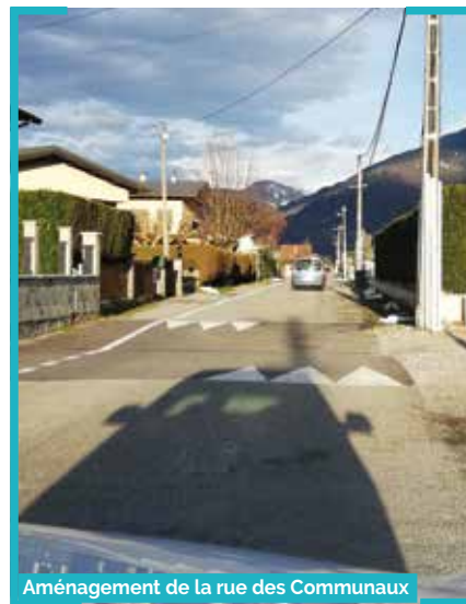
Aménagement de la rue des Communaux