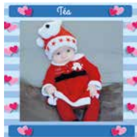
TÉA D'AGOSTIN 27 septembre 2019