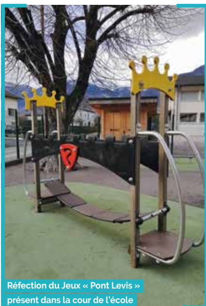
Réfection du Jeu « Pont Levis » présent dans la cour de l'école