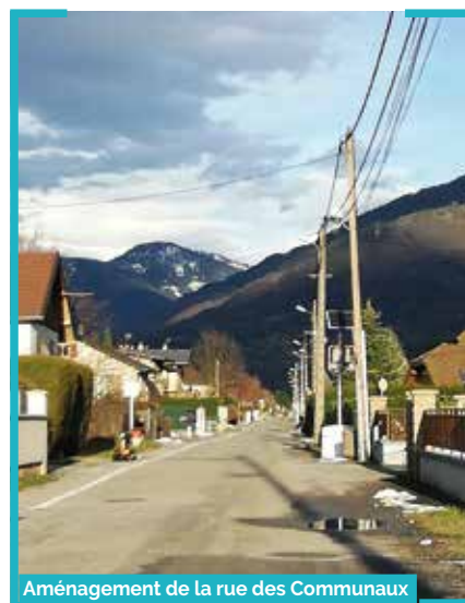
Aménagement de la rue des Communaux