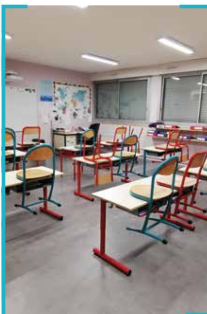
Changement du sol de la salle de classe (6 ème classe)