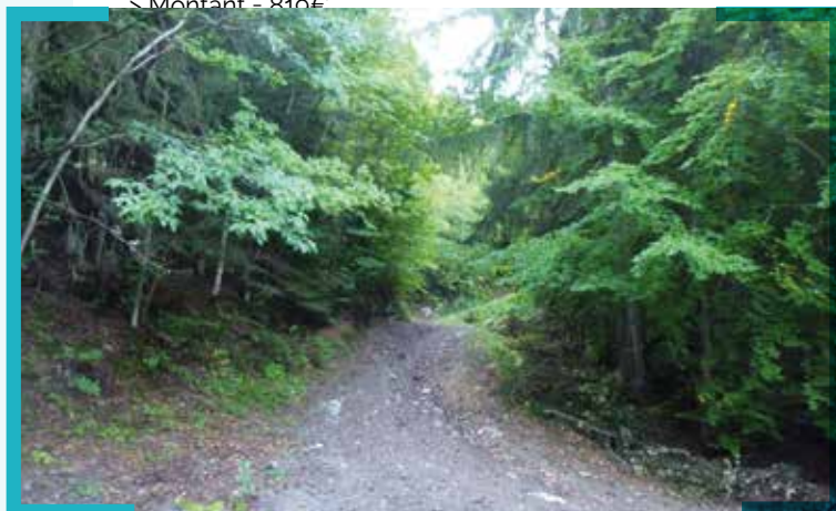
Elagage des pistes sur parcelles M et N