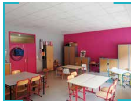
Réfection de la peinture de la garderie ARC EN CIEL