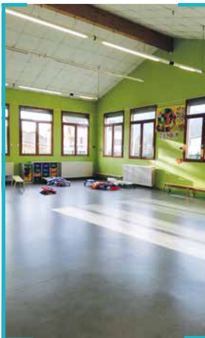
Changement du sol de la salle de motricité