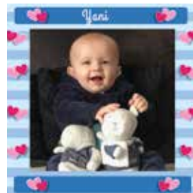
YANI LEVASSEUR 12 juin 2019