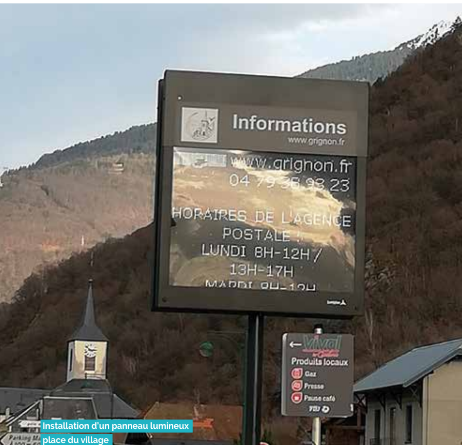
Installation d'un panneau lumineux place du village