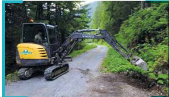
Entretien manuel des renvois d'eau sur la route forestière et sur pistes