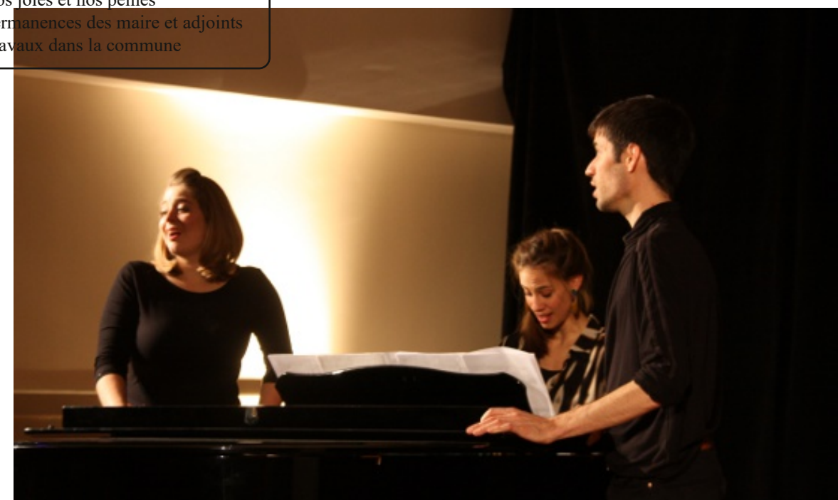
Pendant le concert du 8 décembre (voir aussi page suivante)

Le désamiantage et le remplacement de la toiture du groupe scolaire Joseph Paradis ont été récemment réalisés.