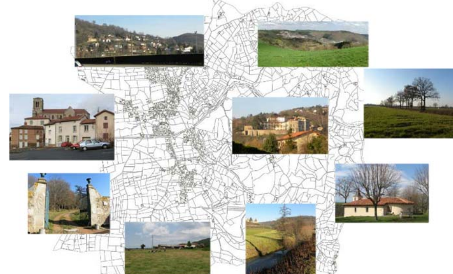
Planche Sud - Echelle : 1/5000

PLAN LOCAL D'URBANISME : Plan d'Occupation des Sols : - Approbation 27 Novembre 1998 - Modification approuvée le 16 Avril 2007 - Révision simplifiée approuvée le 1er Décembre 2009 Plan Local d'Urbanisme : - Prescription par délibération du Conseil Municipal en date du 27 Octobre 2009 - Arrêt du projet le 5 Avril 2016 - Approbation du projet le 12 Décembre 2016 - Vu pour être annexé à la délibération du Conseil Municipal en date du 12 Décembre 2016