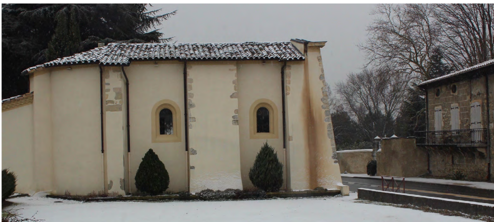
Neige, 28 février 2018