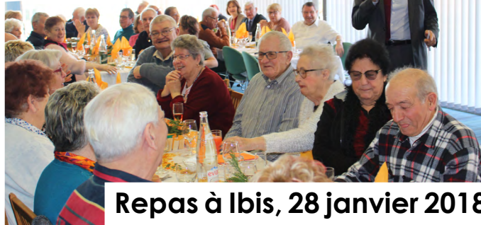
Repas à Ibis, 28 janvier 2018