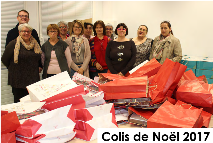
Colis de Noël 2017