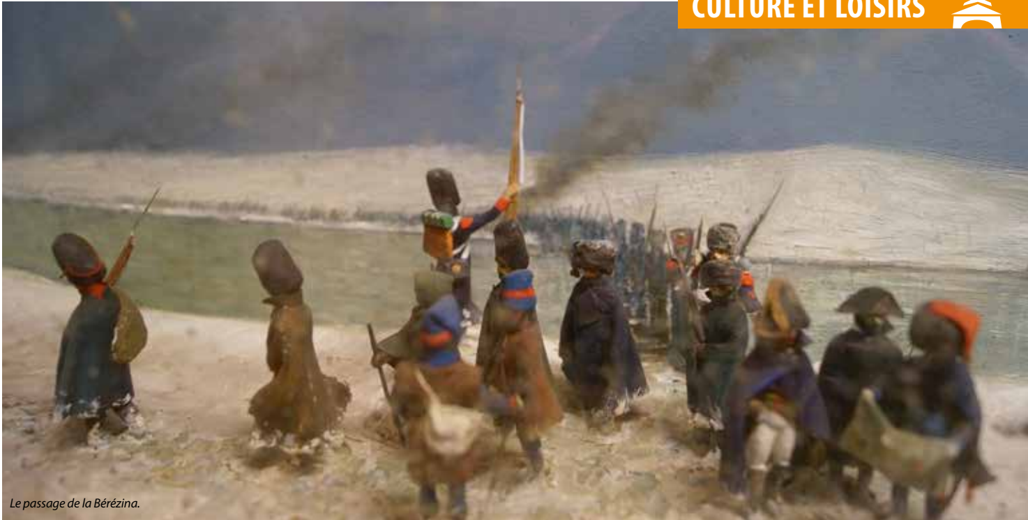
Le passage de la Bérézina.