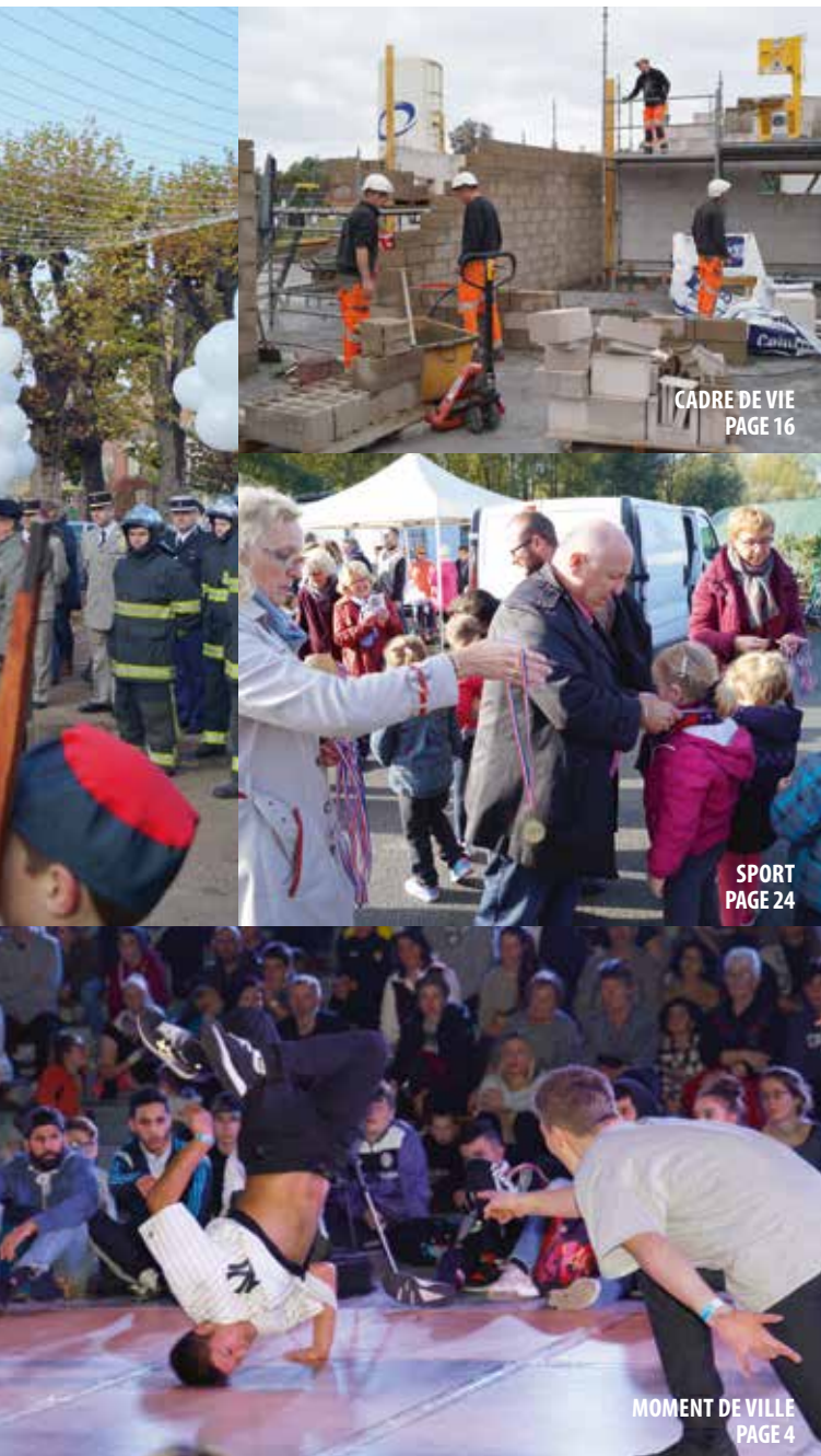
CADRE DE VIE PAGE 16

Une nouvelle fois, très bonne année à toutes et à tous !