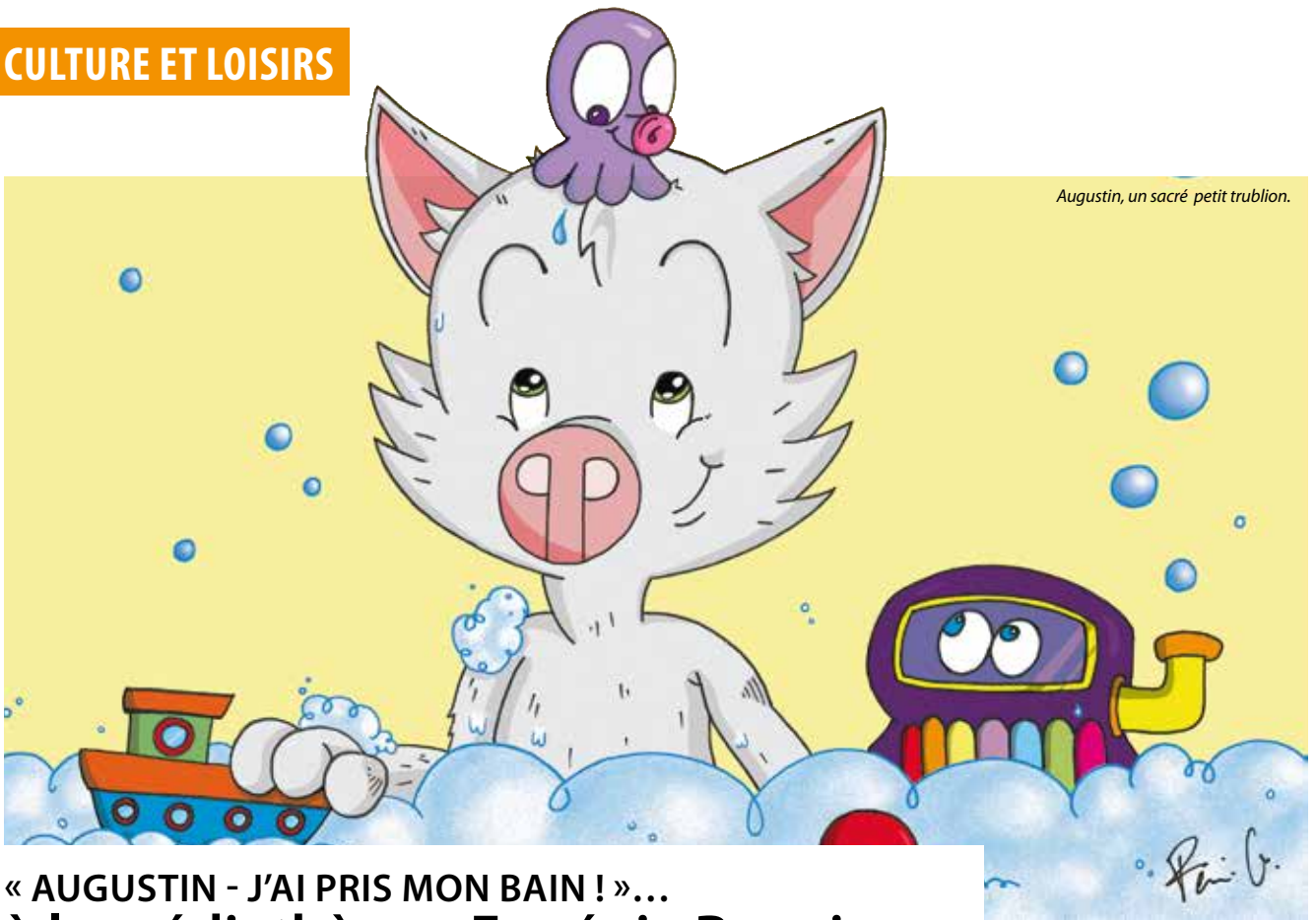
Augustin, un sacré petit trublion.