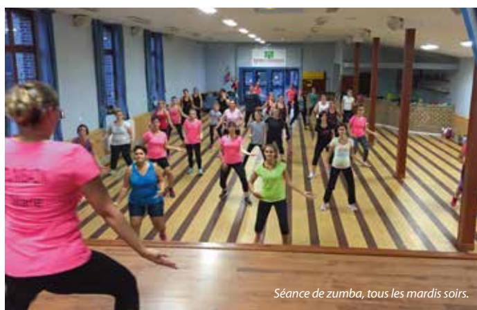
Séance de zumba, tous les mardis soirs.