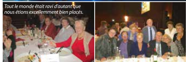
Tout le monde était ravi d'autant que nous étions excellentement bien placés.

Alors, si vous aussi vous voulez entretenir votre mémoire qui parfois vous fait défaut ET si vous voulez vivre de bons moments venez nous rejoindre ! Vous êtes les bienvenus ! Rappel : Au Remue-Méninges, il y a 2 animations chaque jeudi à la salle des fêtes sauf pendant les vacances scolaires, où seule l'animation de 14h à 15h15 est assurée. 1 ère animation de 14h à 15h15, 2 ème animation de 15h30 à 16h45 .