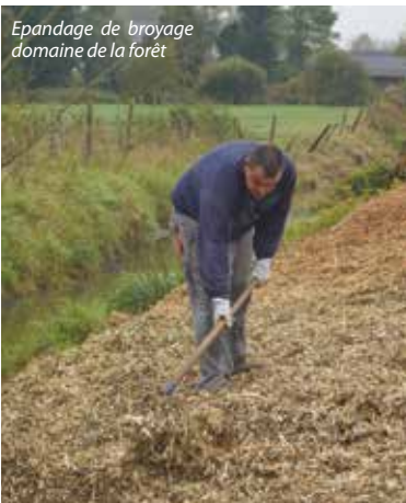
Épandage de broyage domaine de la forêt

notamment dans le cadre de la loi de transition énergétique pour la croissance verte qui met en place l'objectif zéro pesticide dans l'ensemble des espaces publics à compter du 1 er janvier 2017. ■