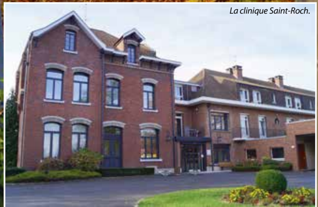
La clinique Saint-Roch.