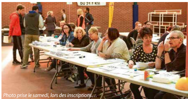
Photo prise le samedi, lors des inscriptions...

LES 8 ET 9 OCTOBRE : pour la 6 ème participation, il y avait 7 personnes le samedi et 3 signaleurs le dimanche pour aider à cette fabuleuse manifestation qu'est le semi-marathon et à laquelle il nous plait beaucoup d'être présents.