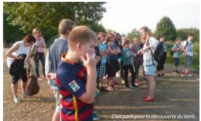
C'est parti pour la découverte du terril.

Avant de reprendre la route du collège, les élèves et leurs accompagnateurs ont pique-niqué près de la Maison du Terril. À leur retour, les trois classes ont été divisées en petits groupes pour effectuer un parcours d'activités animées par des professeurs et des membres de l'équipe éducative à travers le collège. Voici un aperçu des ateliers proposés : jeu de l'oie sur le thème de Jack et le haricot magique, en anglais ; blind-test musical sur les chansons de l'année 2016