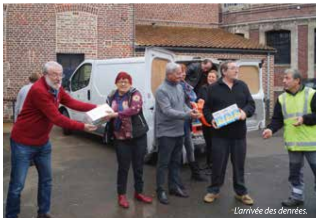
L'arrivée des denrées.

Pour permettre la mise en place de toutes ces actions, le fonctionnement des Restos est très structuré. Au niveau national, il y a tout d'abord l'association nationale des Restos, puis viennent 11 antennes, 118 associations départemen-