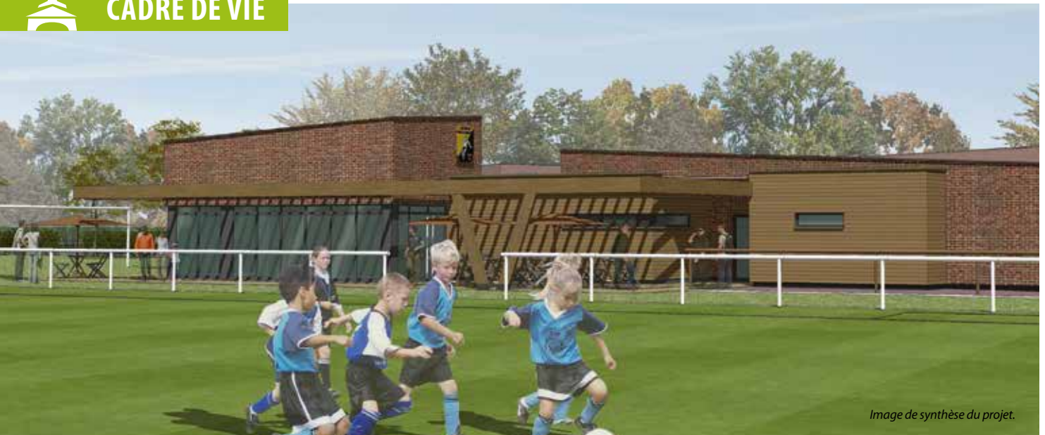
Image de synthèse du projet.