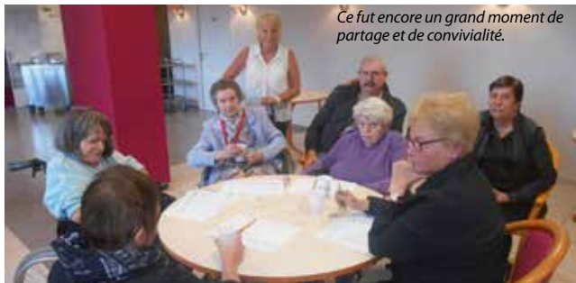
Ce fut encore un grand moment de partage et de convivialité.

LUNDI 3 OCTOBRE : dans le cadre de la semaine bleue et de la semaine du goût, nous nous sommes rendus à la Résidence Emile Dubois pour un atelier animé en binôme par les animatrices. Cette année, les exercices étaient en rapport