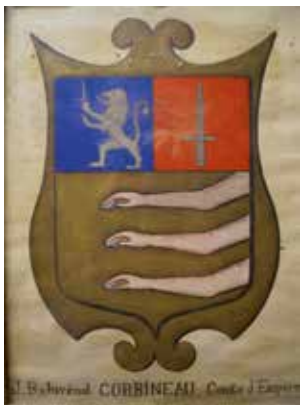
Le blason de la famille Corbineau.