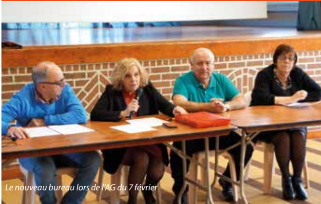
Le nouveau bureau lors de l'AG du 7 février