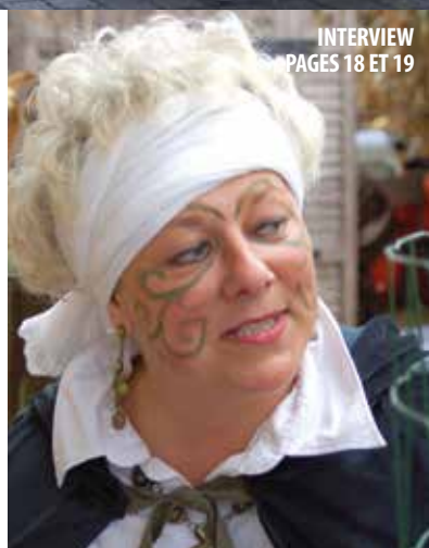
INTERVIEW PAGES 18 ET 19