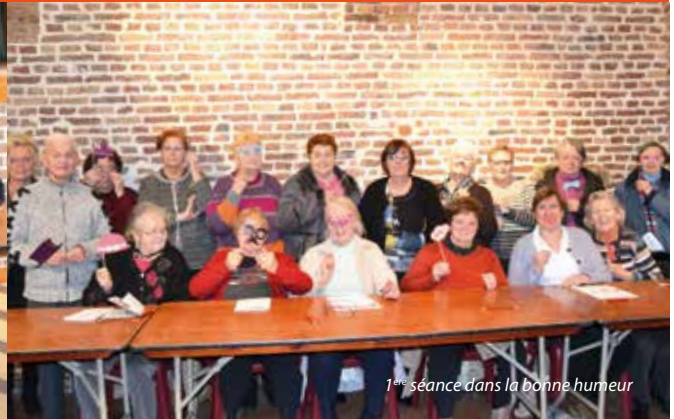
1 ère séance dans la bonne humeur