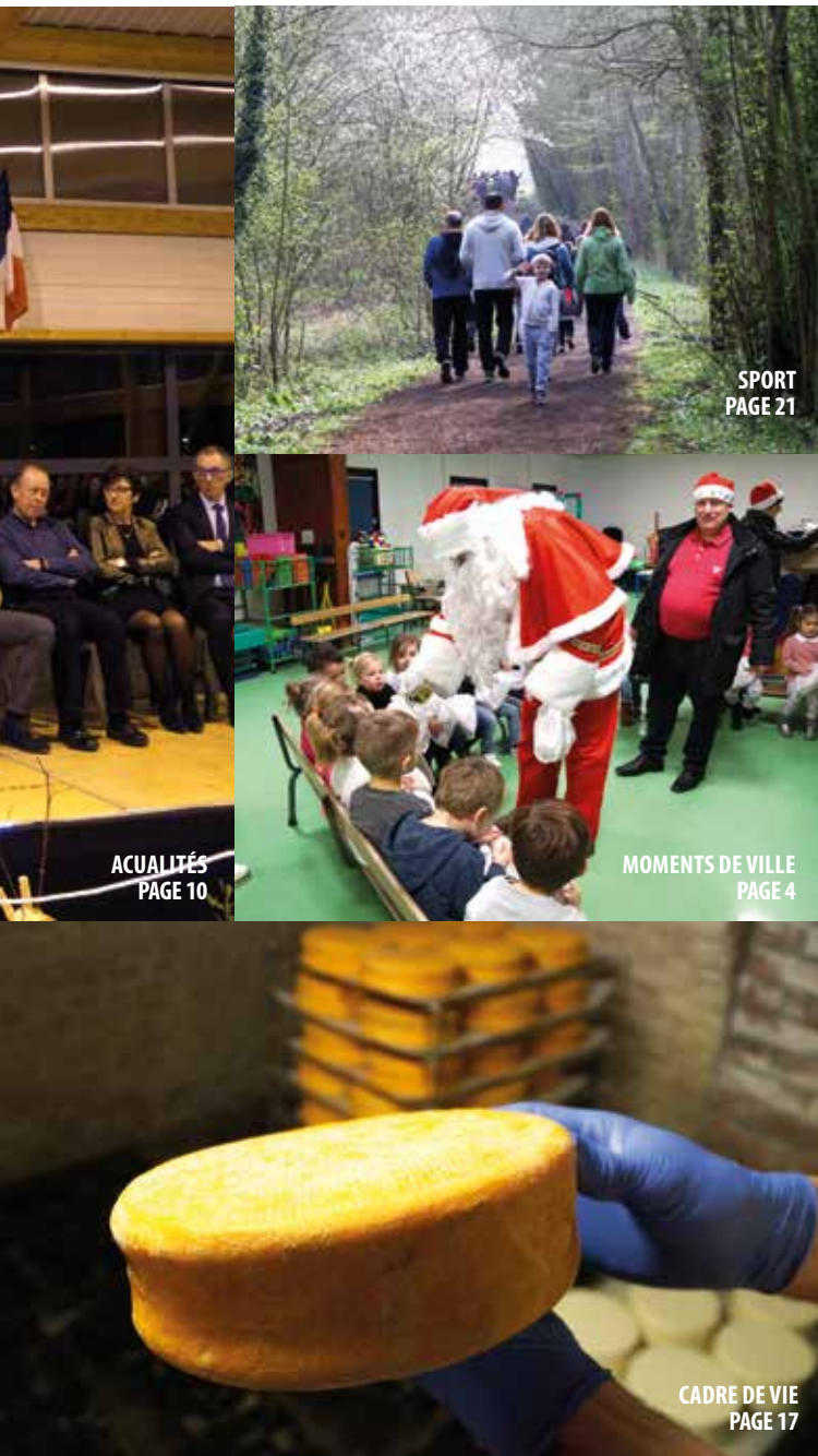
SPORT PAGE 21