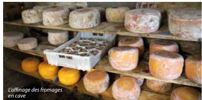
L'affinage des fromages en cave

Installé dans sa petite salle de transformation, au sein de la ferme familiale, Rémi assure trois fabrications par semaine, en moyenne. Les étapes en sont bien établies, les recettes et les gestes maîtrisés. Après la traite de 7h, s'ensuivent dans la même journée, la maturation du lait, l'ajout de la présure, la découpe des blocs de caillé, le brassage, le moulage, le retournage des moules et la pose de poids sur les moules. Viennent ensuite le démoulage, le salage à sec ou en saumure puis l'affinage en cave, entrecoupé de nombreux brossages. En fonction des fromages, il faut attendre entre 10 jours et 4 mois pour les emballer.