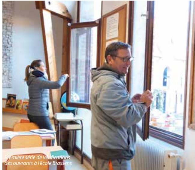
Première série de vérifications des ouvrants à l'école Brassens

Une fois ces fiches et grilles remplies en interne, le Cœur d'Ostrevent poursuivra son accompagnement et apportera son expertise pour mettre en place des actions concrètes. Il indique que « cet audit ne donne lieu à aucune sanction mais constitue une véritable démarche de progrès ». Des actions simples et peu coûteuses ont déjà été évoquées le 12 décembre : ouvrir plus fréquemment les fenêtres, notamment en cas d'activités utilisant des produits émetteurs de polluants, aérer les pièces pendant et après les activités de nettoyage, choisir des produits moins émissifs pour le matériel d'entretien mais aussi de décoration en cas de travaux (peinture, revêtement de sol...). Les auto-diagnostics et le programme de bonnes pratiques retenus seront consignés