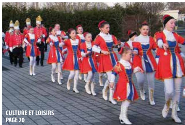
CULTURE ET LOISIRS PAGE 20