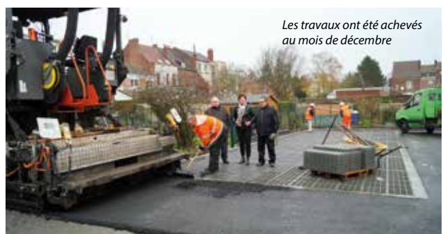
Les travaux ont été achevés au mois de décembre

Cette réalisation répond à un besoin de stationnement dans la commune. 38 places sont matérialisées dont deux pour les conducteurs à mobilité réduite. L'ensemble s'est vu doté d'éclairage pour faciliter et sécuriser son accès. Ce projet s'est concrétisé pour un coût de 190 177 € TTC (travaux pour 179 377 € TTC et assistance à maîtrise d'ouvrage pour 10 800 € TTC).