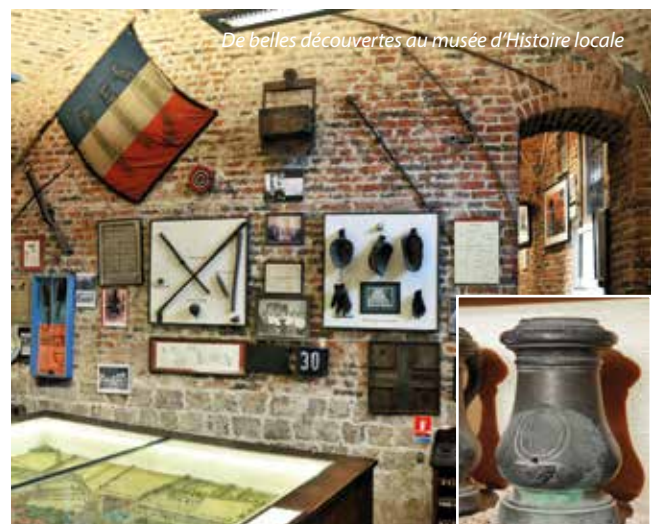
De belles découvertes au musée d'Histoire locale