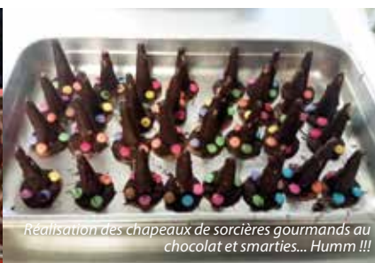
Réalisation des chapeaux de sorcières gourmands au chocolat et smarties... Humm !!!