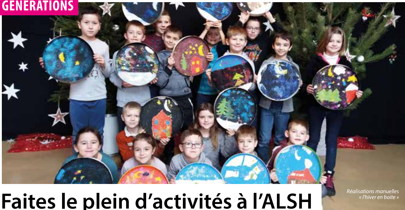
Réalisations manuelles « l'hiver en boîte »