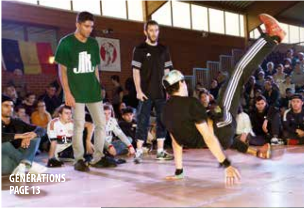
GÉNÉRATIONS PAGE 13