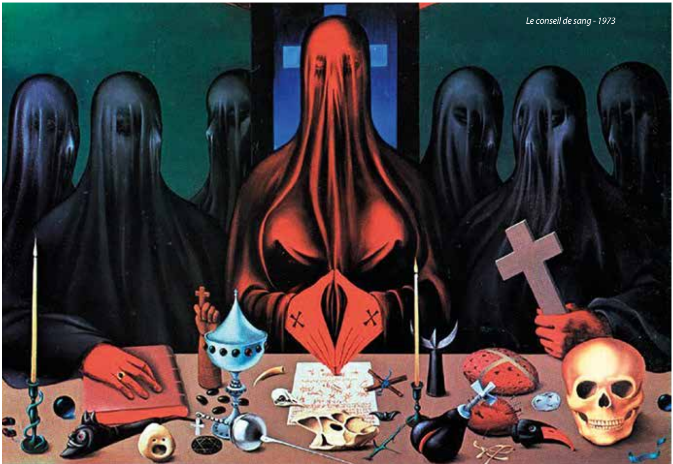
Le conseil de sang - 1973

raires et il participe à de nombreuses expositions en France et à l'étranger. Il côtoie alors les plus grands comme Barrault, Sartre, Jovet, Éluard, Prévert, Queneau, Desnos, Masson mais aussi Ernst, Dalí et Magritte... La reconnaissance de ses pairs arrive en mars 1966 quand il est élu à l'Académie des Beaux-Arts.