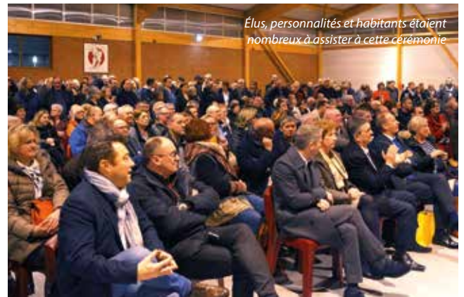
Élus, personnalités et habitants étaient nombreux à assister à cette cérémonie

Les grandes orientations pour l'année nouvelle ont ensuite été exposées. Le Maire a affirmé que les travaux de la nou-