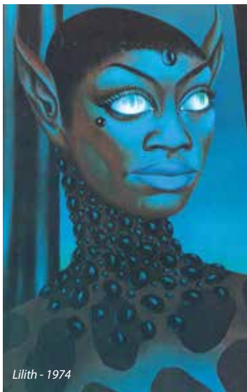
Lilith - 1974

licornes, tribus de diables cornus tout droit sortis de son imagination ou forêts étranges peuplées d'envoûtantes sorcières sont sa marque de fabrique. En 1966, lors de l'un de ses