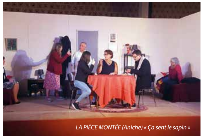
LA PIÈCE MONTÉE (Aniche) « Ça sent le sapin »

HÉRITAGE CELTIQUE (Somain) ; ART ET COMPAGNIES (Flines-lez-Râches) ; La BTP (troupe d'impro) ; LES TEMPLEMARTIENS (Templeuve) ; MJC de Douai (claquette, théâtre)... seront prochainement de la fête. Nous avons trouvé des troupes diverses et variées afin de proposer des spectacles pour tous. NOUS VOUS ATTENDONS !