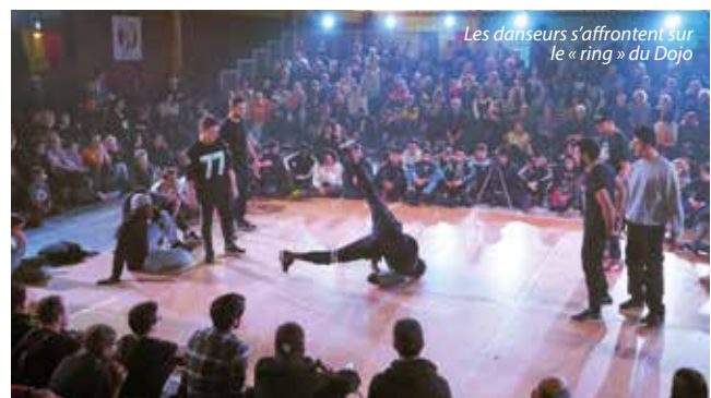
Les danseurs s'affrontent sur le « ring » du Dojo