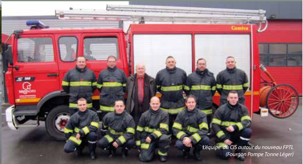
L'équipe du CIS autour du nouveau FPTL (Fourgon Pompe Tonne Léger)

Voici une nouvelle année qui se présente. Nous vous souhaitons une bonne année, et surtout une bonne santé à vous et à vos proches. Puissiez-vous passer cette année en toute sécurité car la prévention est l'affaire de tous, ceci pour éviter tout risque de danger.