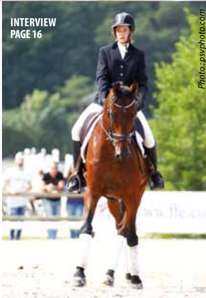
INTERVIEW PAGE 16