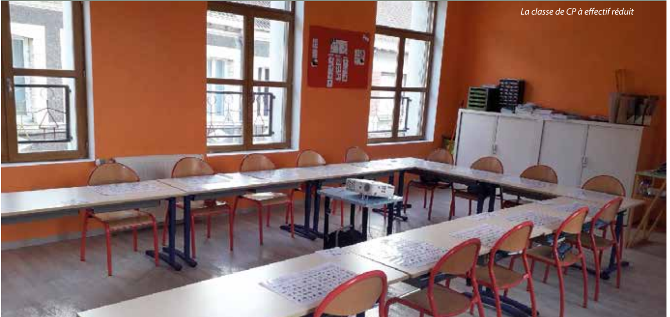
La classe de CP à effectif réduit