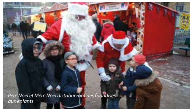
Père Noël et Mère Noël distribueront des friandises aux enfants

Pour parfaire l'ambiance magique du marché, les organisateurs ont redoublé d'inventivité pour décorer le site et le rendre une nouvelle fois unique. Un univers féérique qui durant le jour dévoile de magnifiques décorations et à la nuit tombée, fait scintiller l'ancienne abbaye de mille feux pour le plus grand bonheur des badauds. Côté animations, jeux anciens, espace maquillage, crèche de Noël, manège seront au programme... les conteuses et conteurs de Marchiennes seront présents en salle Moïse Dufour pour vous livrer de magnifiques histoires de Noël. Le père Noël déambulera tout le week-end accompagné de sa chère et tendre épouse. Il s'élançera d'ailleurs le dimanche soir à 18h30 du haut de la médiathèque sous les encouragements des petits et des