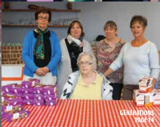
GÉNÉRATIONS PAGE 14