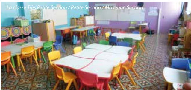
La classe Très Petite Section / Petite Section / Moyenne Section

Pour tous renseignements, n'hésitez pas à visiter le site de l'école www.stetheresemarchiennes.fr ou à appeler le 03 27 90 40 11. Les inscriptions pour 2019/2020 ont déjà débuté ! Madame Meerschman reçoit sur rendez-vous.