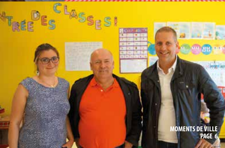
MOMENTS DE VILLE PAGE 6