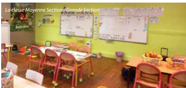
La classe Moyenne Section / Grande Section