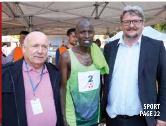
SPORT PAGE 22

Je vous souhaite d'excellentes fêtes de fin d'année.