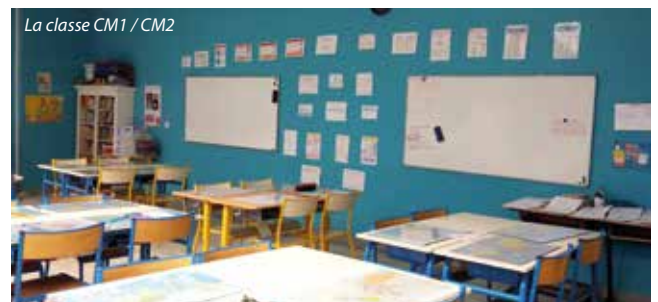
La classe CM1 / CM2