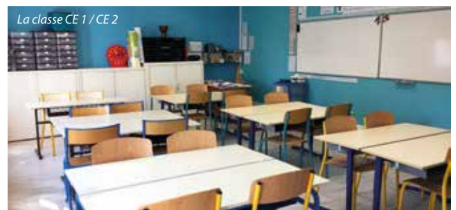
La classe CE 1 / CE 2