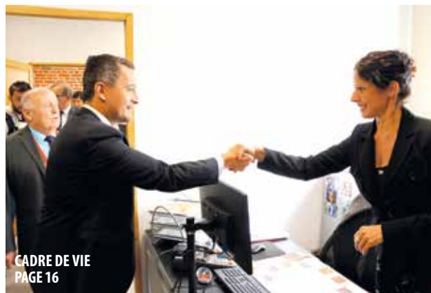
CADRE DE VIE PAGE 16