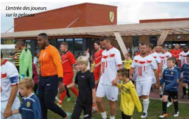
L'entrée des joueurs sur la pelouse