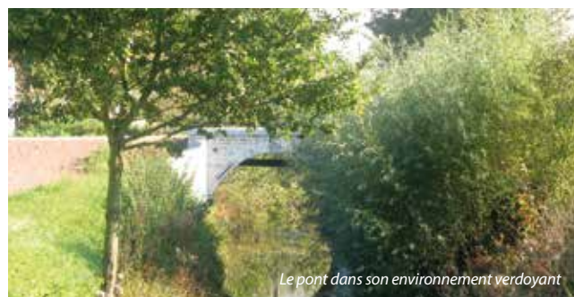
Le pont dans son environnement verdoyant

En plus de son intérêt historique incontestable, cet ouvrage présente de remarquables caractéristiques architecturales. Les bâtisseurs ont utilisé trois matériaux lors de l'édification des maçonneries de cet ouvrage hydraulique : la brique, la pierre bleue (de Tournai) et surtout le gré. L'utilisation du gré sur les deux élévations confère d'ailleurs une noblesse à l'ensemble que viennent souligner en amont et en aval les deux clefs sculptées des arcs.