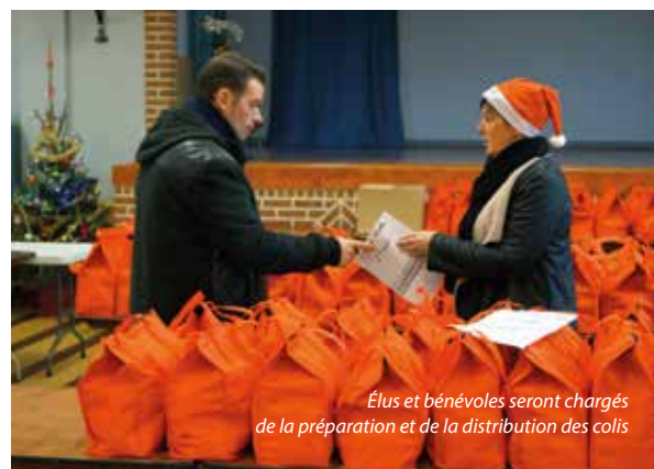
Élus et bénévoles seront chargés de la préparation et de la distribution des colis

Pour tout renseignement : contacter Hélène Barret, responsable du CCAS au 03 27 94 45 12.