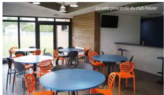
La salle principale du club-house

Élus et responsables d'associations espèrent maintenant que le lieu sera le théâtre d'intenses et de belles manifestations sportives, de beaux matches de football et pourquoi pas de quelques exploits qui permettront de justifier l'engagement humain et financier des uns et des autres qui donne aux Marchiennois la possibilité de s'épanouir dans la commune. Les dirigeants de l'Olympic Marchiennois avaient d'ailleurs à cœur de réussir cette grande première et de mettre le football à l'honneur avec l'organisation de plusieurs rencontres. L'après-midi a débuté par un match de gala opposant les anciens joueurs du LOSC à ceux de Valenciennes suivi d'un match des U17 du club contre l'équipe de l'ES Cappelle. Une opposition des séniors locaux au club de Beuvry-la-Forêt est