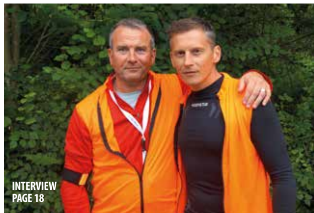
INTERVIEW PAGE 18