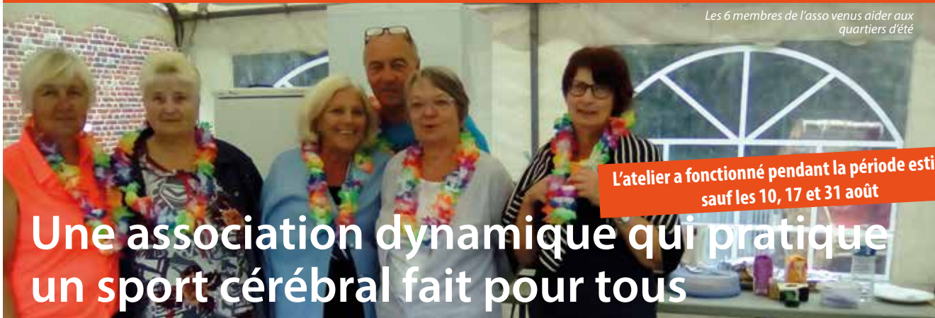
Les 6 membres de l'asso venus aider aux quartiers d'été

L'atelier a fonctionné pendant la période estivale sauf les 10, 17 et 31 août