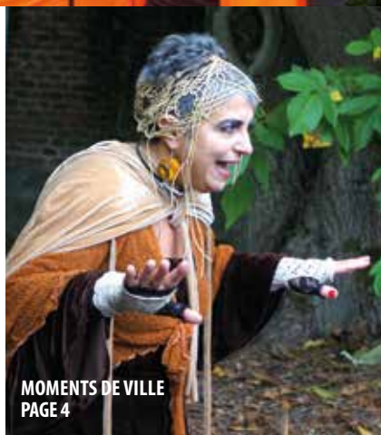
MOMENTS DE VILLE PAGE 4