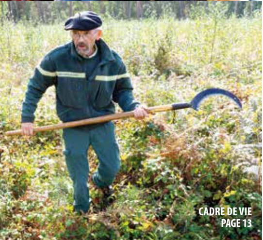
CADRE DE VIE PAGE 13