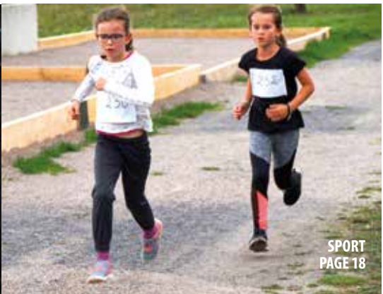
SPORT PAGE 18