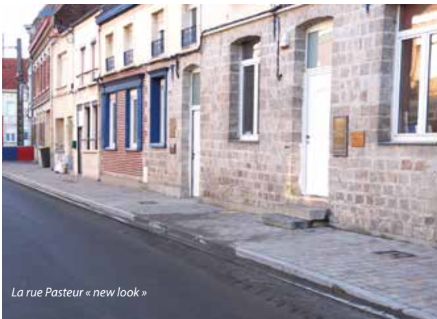
La rue Pasteur « new look »

Cette opération d'envergure, entreprise depuis le mois de mars est maintenant terminée. Dans un premier temps, No-réade a réalisé la rénovation du réseau et des branchements d'assainissement pour les eaux pluviales et usées. Les travaux de voiries sont ensuite intervenus par l'intermédiaire de l'entreprise Eiffage. Le Département a pris en charge la restauration de la chaussée alors que la Ville a financé à hauteur de 579 456 € TTC les trottoirs, les bordures, l'éclairage public et l'enfouissement des réseaux électriques et électroniques.