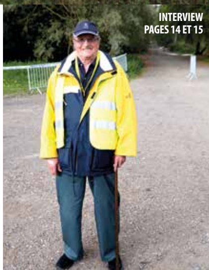
INTERVIEW PAGES 14 ET 15