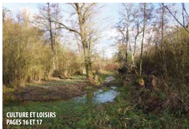
CULTURE ET LOISIRS PAGES 16 ET 17