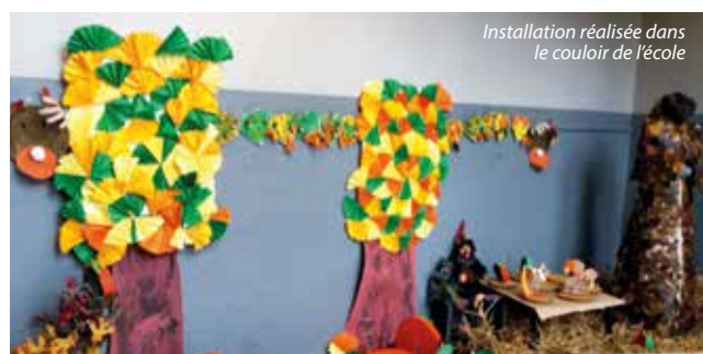
Installation réalisée dans le couloir de l'école

équipe et se parfaire dans les disciplines déjà proposées aux vacances précédentes afin d'améliorer leurs compétences. Toutes les activités réalisées ont été présentées aux familles en exposition dans le hall de la garderie. ■