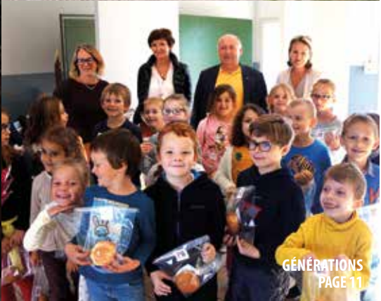
GÉNÉRATIONS PAGE 11