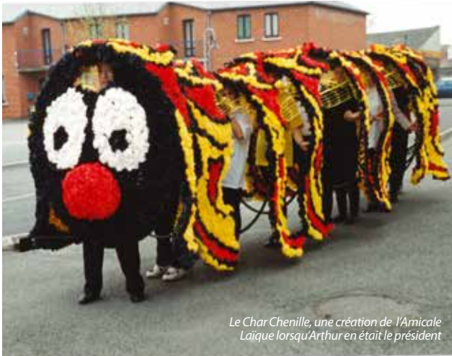
Le Char Chenille, une création de l'Amicale Laïque lorsqu'Arthur en était le président