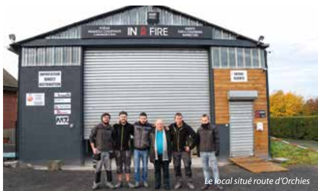
Le local situé route d'Orchies

Contact : In Fire, 1 route d'Orchies, 07 64 08 44 89