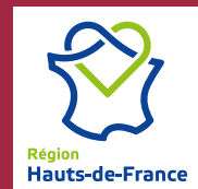
Édité par la Région Hauts-de-France - Avril 2018