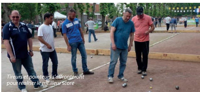
Tireurs et pointeurs s'affronteront pour réaliser le meilleur score

Plus de 450 accros du bouchon comme on dit à Marseille (ou cochonnet à la parisienne) seront une nouvelle fois présents sur cet événement avec des délégations étrangères du Luxembourg, d'Allemagne, de Belgique ou encore d'Angleterre. Le concours se jouera en tripléte pour les concours des catégories hommes et en doublette pour les concours