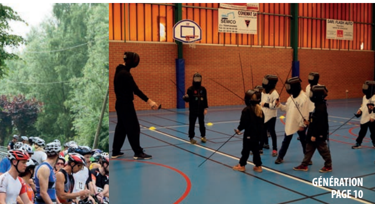
GÉNÉRATION PAGE 10