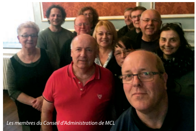
Les membres du Conseil d'Administration de MCL

La bonne humeur, l'envie de partager, de découvrir ensemble, sont ses ambitions. Si vous vous sentez une âme d'artiste, de créateur, et que vous souhaitez transmettre votre passion, rejoignez-nous !