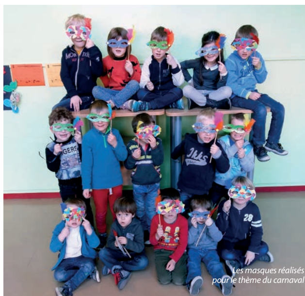
Les masques réalisés pour le thème du carnaval

Les enfants ont également pu s'initier à des pratiques sportives parfois très originales grâce à un partenariat avec le Département du Nord : de l'athlétisme, du flag foot (sport dérivé du football américain où les plaquages sont remplacés par l'arrachage de bandes de tissus accrochées à la ceinture des joueurs), du hockey, de l'escrime et du taekwondo. De quoi faire marcher la tête et les jambes, et toujours dans la bonne humeur ! ■