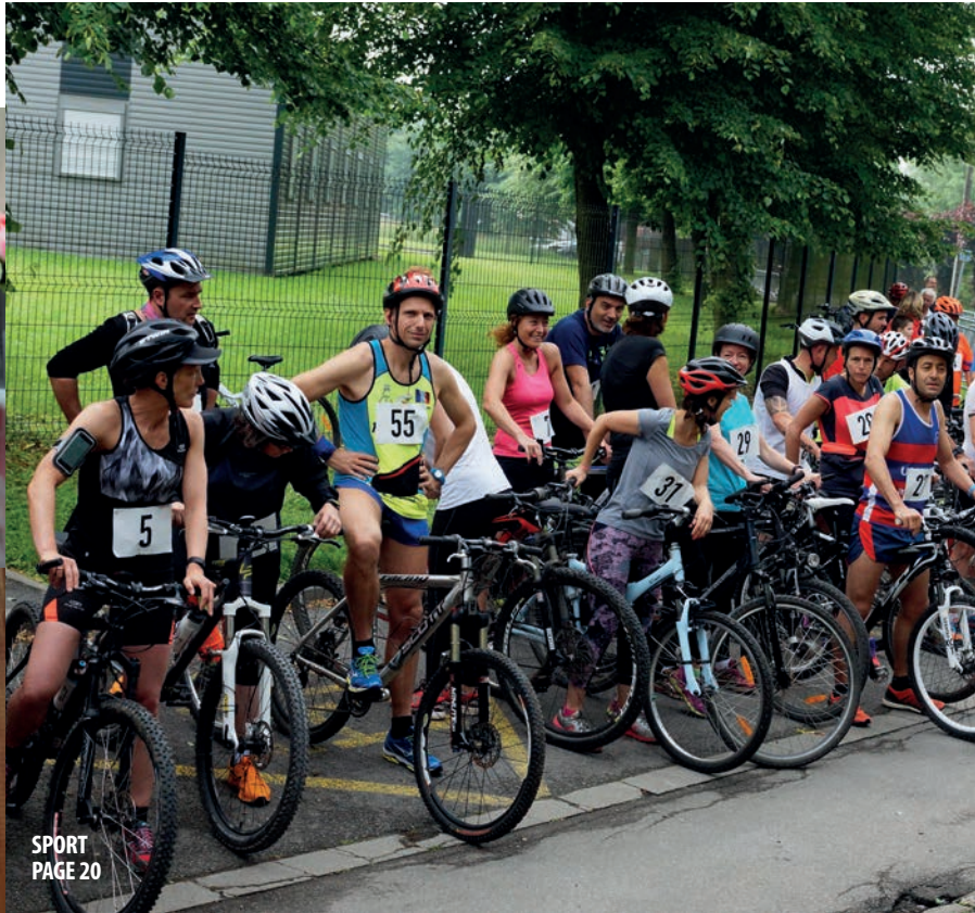
SPORT PAGE 20