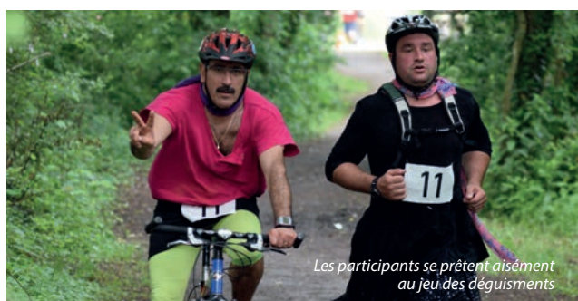
Les participants se prêtent aisément au jeu des déguisements

proposés pour s'adapter à tous : à 9h25 une course des moustiques de 1,5 km (avec un parent) pour les 6-9 ans, à 9h15 une course des guêpes sur 7 km pour les 10-14 ans, et à 10h une course adultes de 12 km. La sensibilisation à la discipline chez les plus jeunes a été particulière-