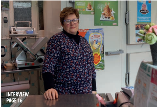
INTERVIEW PAGE 16