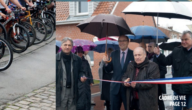
CADRE DE VIE PAGE 12