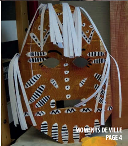
MOMENTS DE VILLE PAGE 4