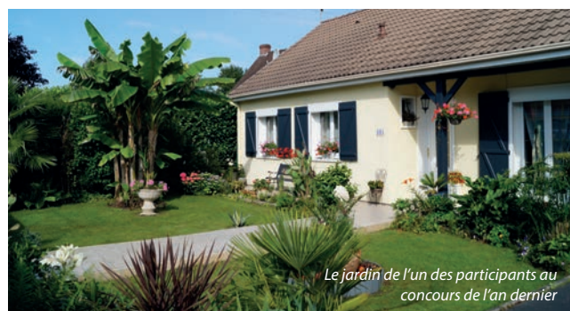
Le jardin de l'un des participants au concours de l'an dernier

L'an dernier, plus d'une vingtaine de passionnés de jardinage avait participé avec brio à l'embellissement du cadre de vie. Les concurrents de cette année auront certainement à cœur de faire preuve d'ingéniosité et d'originalité dans leurs créations. À la période estivale, le patrimoine paysager reflète en effet les efforts de chacune et de chacun.