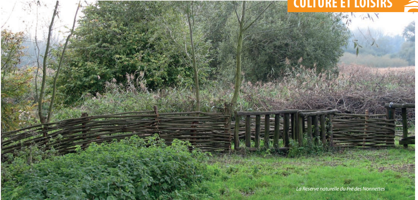
La Réserve naturelle du Pré des Nonnettes