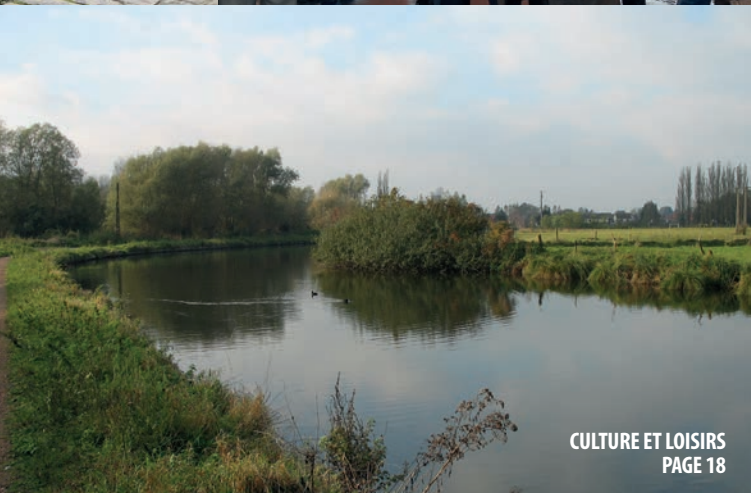
CULTURE ET LOISIRS PAGE 18