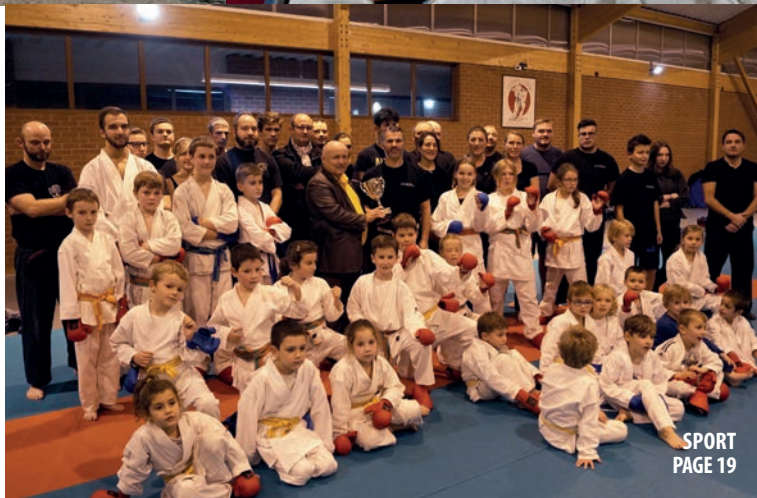
SPORT PAGE 19