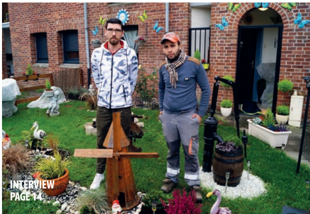
INTERVIEW PAGE 14