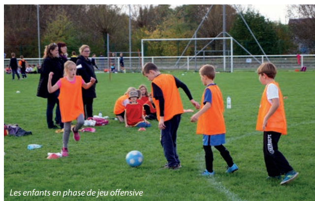
Les enfants en phase de jeu offensive

Pour l'USEP les Pumas du Grand Meaulnes, organisateur de cette rencontre, ce projet était aussi un moyen de faire travailler les enfants de façon transversale et interdisciplinaire en classe. Ainsi, pendant plusieurs semaines, les élèves de CE2/CM1/CM2 de Monsieur Grislin ont trouvé un vrai sens aux apprentissages du quotidien. La langue française a