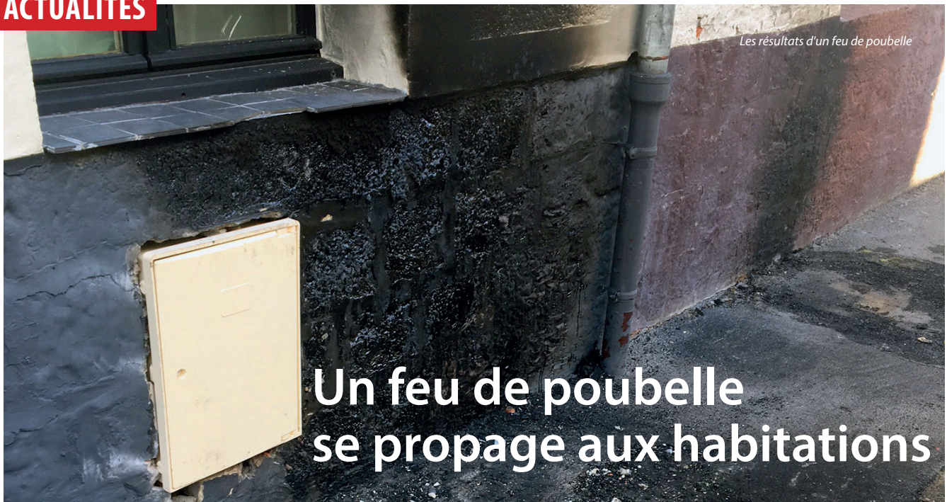
Les résultats d'un feu de poubelle