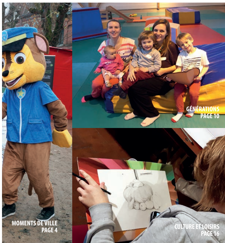
MOMENTS DE VILLE PAGE 4