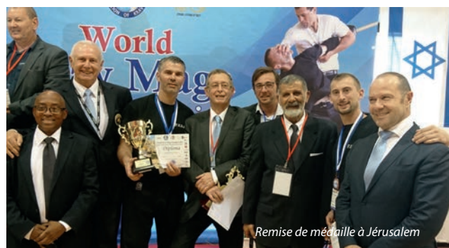
Remise de médaille à Jérusalem