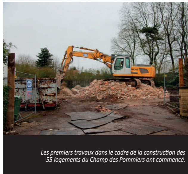
Les premiers travaux dans le cadre de la construction des 55 logements du Champ des Pommiers ont commencé.

Les règles de confinement s'adressent au plus grand nombre. À ce titre, les travaux non essentiels sont arrêtés. Au niveau de la commune, cela concerne tout aussi bien l'entretien des espaces verts, le balayage mécanique de la commune que la pose des nouvelles huisseries de la mairie prévue le mois dernier.