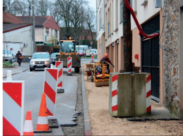
Le trottoir au pied des 94 nouveaux logements rue des Remparts est en cours de réalisation.

Le SICTOM n'assurant plus la collecte des déchets verts, ils ne doivent plus être utilisés, notamment pour éviter tout risque d'incendie qui pourrait être généré par la fermentation. Rappel, le brûlage des déchets verts est interdit et répréhensible. Merci.