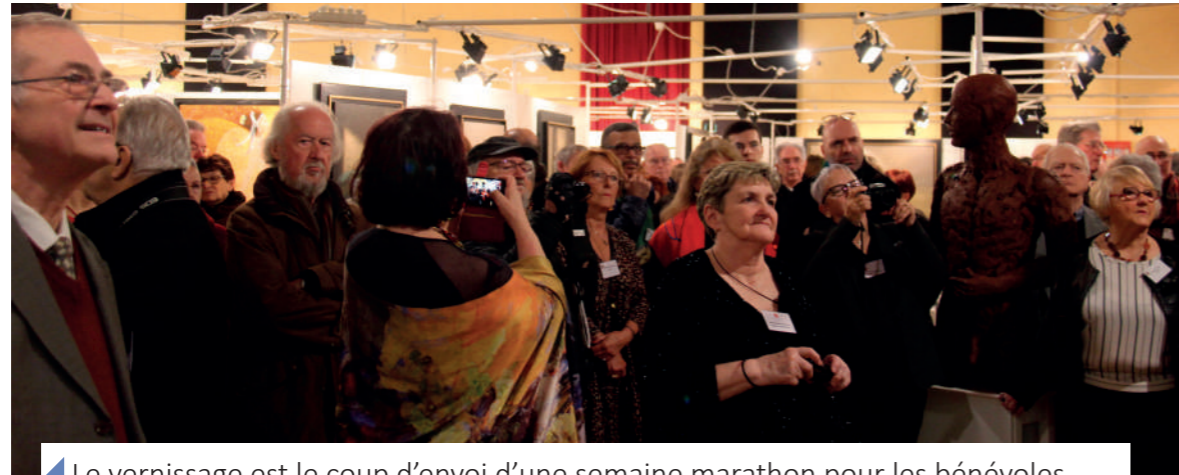
Le vernissage est le coup d'envoi d'une semaine marathon pour les bénévoles d'Art Passion Arnolprien. Des centaines de visiteurs ont une nouvelle fois franchi les portes du Colombier.