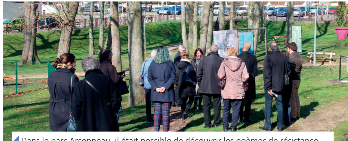
Dans le parc Arsonneau, il était possible de découvrir les poèmes de résistance écrits par Aragon dans la clandestinité.