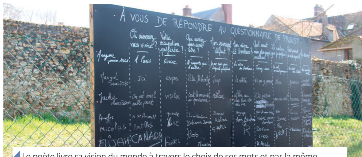
Le poète livre sa vision du monde à travers le choix de ses mots et par la même occasion, dévoile une partie de lui. Certains d'entre-nous ont eu le courage de se dévoiler en répondant à un questionnaire de Proust mis en place avenue Henri Grivot.