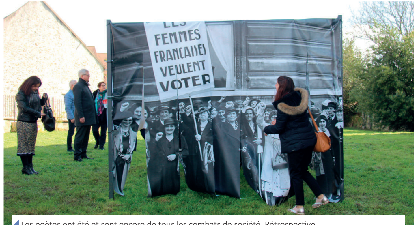
Les poètes ont été et sont encore de tous les combats de société. Rétrospective.