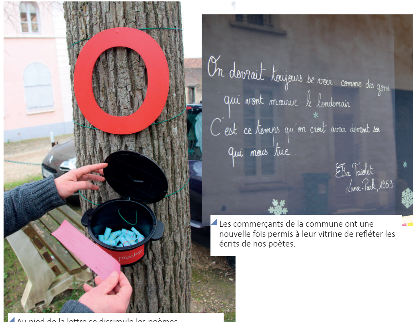
Les commerçants de la commune ont une nouvelle fois permis à leur vitrine de refléter les écrits de nos poètes.