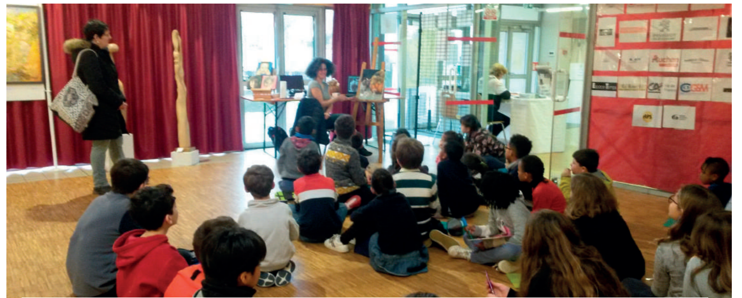
Jeunes inconditionnels du Salon d'Art, les écoliers accompagnés de leurs enseignants ont planché durant une heure autour de certaines œuvres.