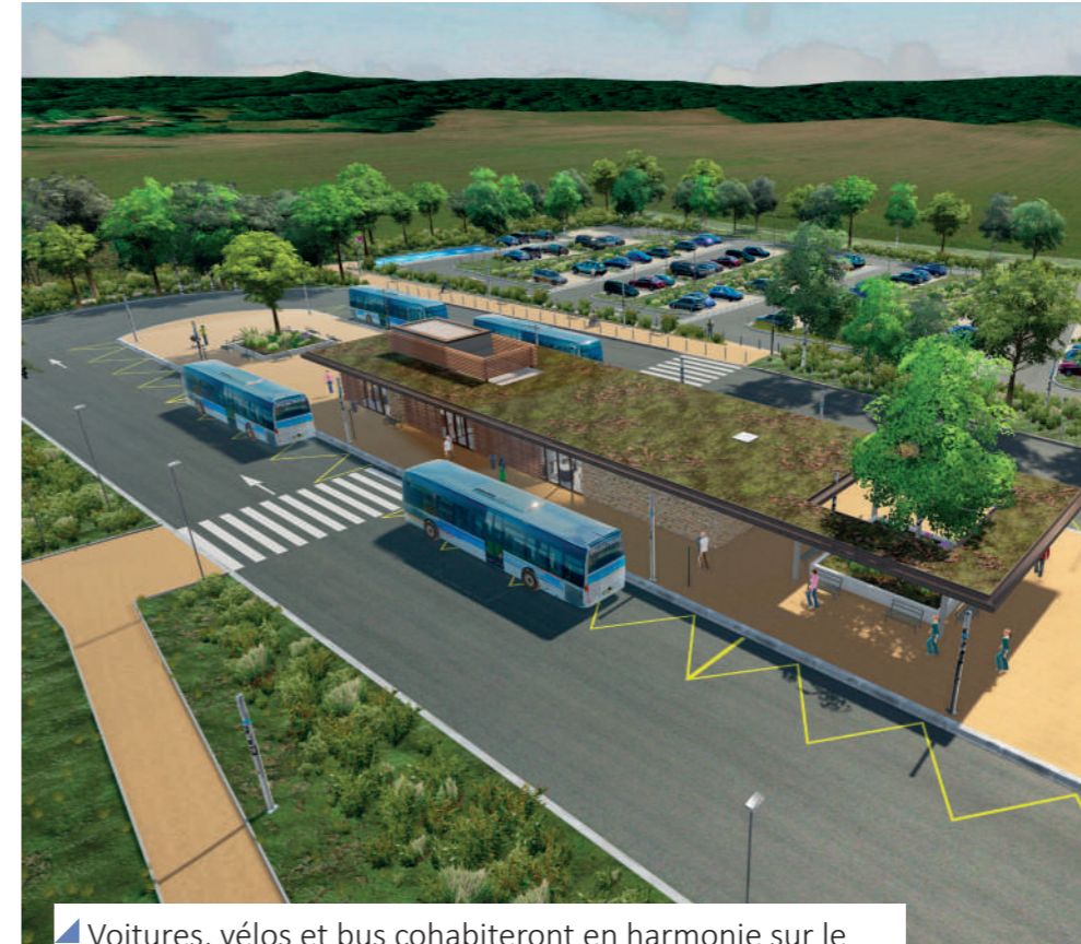
Voitures, vélos et bus cohabiteront en harmonie sur le nouveau parc multimodal.

Les travaux mènent bon train le long du Chemin départemental 149 entre Longvilliers et Dourdan, à l'entrée de l'autoroute A10. À leur terme, les usagers disposeront d'un parking de 255 places de stationnement assorti de nombreux services.