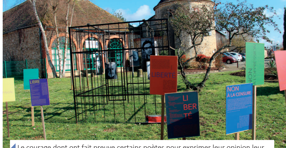
Le courage dont ont fait preuve certains poètes pour exprimer leur opinion leur ont valu d'être enfermés.

Courage, restons confinés et nous vaincrons !