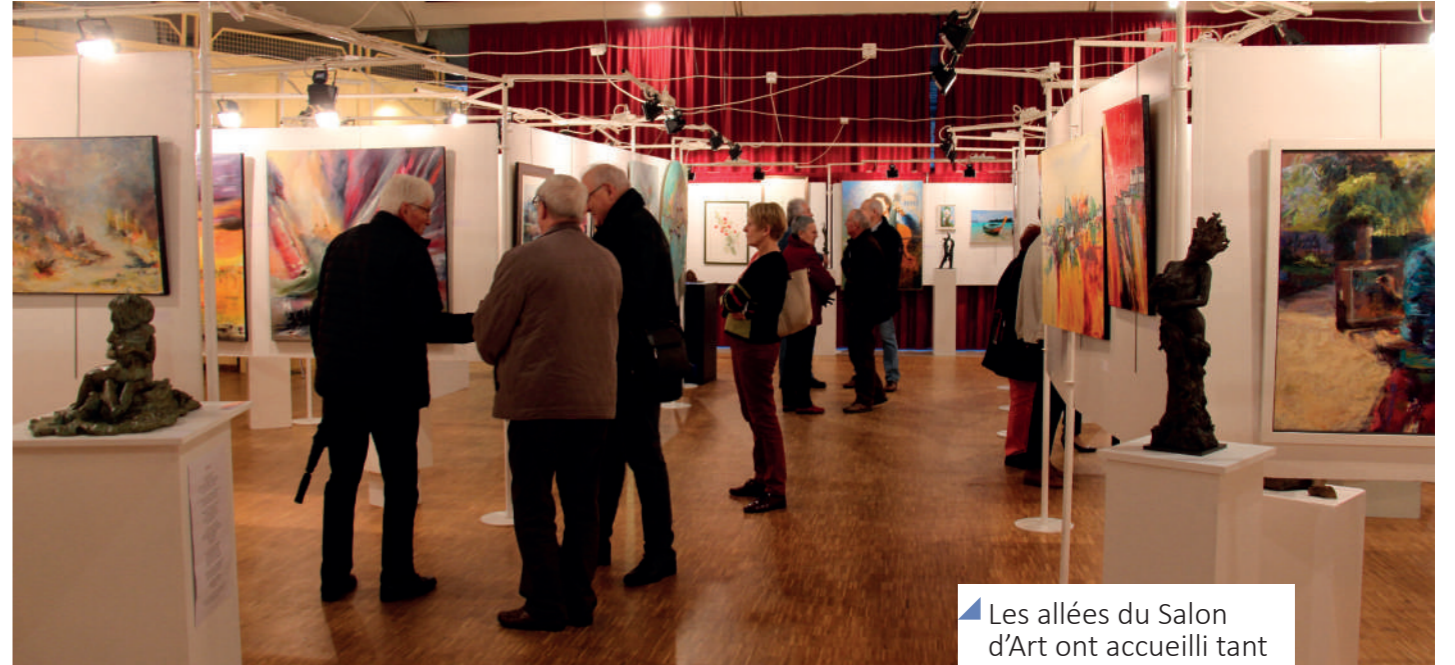
Les allées du Salon d'Art ont accueilli tant les visiteurs que les passionnés.