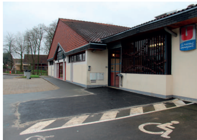
Un nouvel enrobé a été posé sur le trottoir commun à l'accès du Cratère et du centre commercial des Remparts.