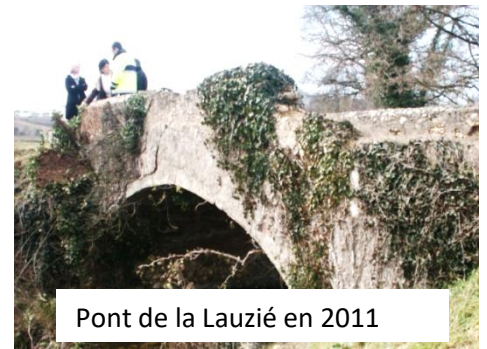
Pont de la Lauzié en 2011

La rénovation du pont de la Lauzié n'était pas finie que le pont de Sottes a subi le même outrage : un véhicule a fait basculer tout le garde-corps amont dans le ruisseau.