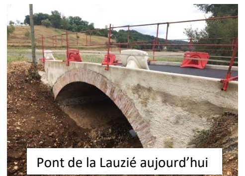
Pont de la Lauzié aujourd'hui

Les services de l'agglomération sont venus le sortir du ruisseau et ont sécurisé le pont avant sa réfection sûrement l'année prochaine