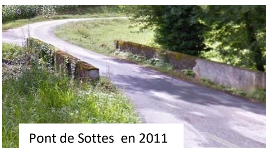
Pont de Sottes en 2011

Les services de l'agglomération sont venus le sortir du ruisseau et ont sécurisé le pont avant sa réfection sûrement l'année prochaine