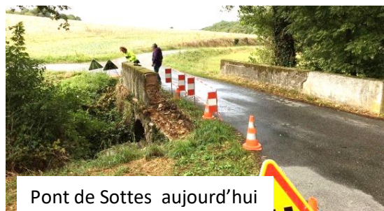
Pont de Sottes aujourd'hui