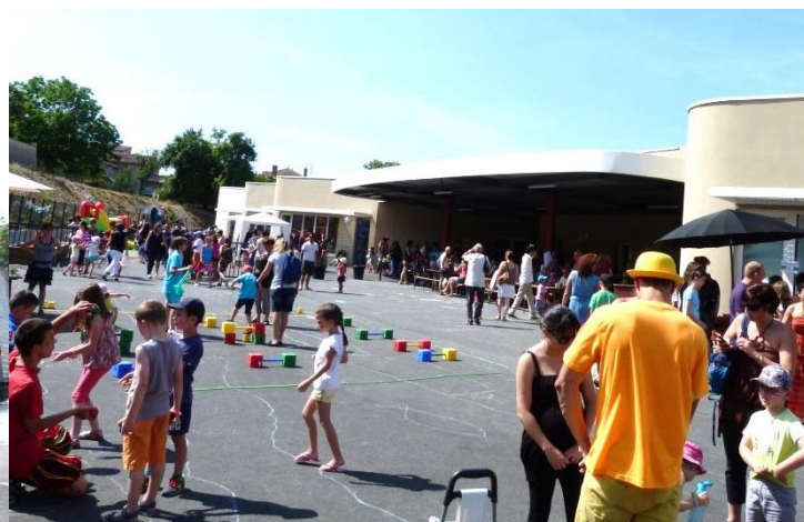
Fête de l'école