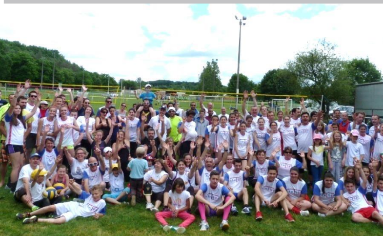
Animation volley lors de la fête du village