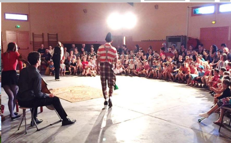
Cirque Pacotille pour les enfants de l'école