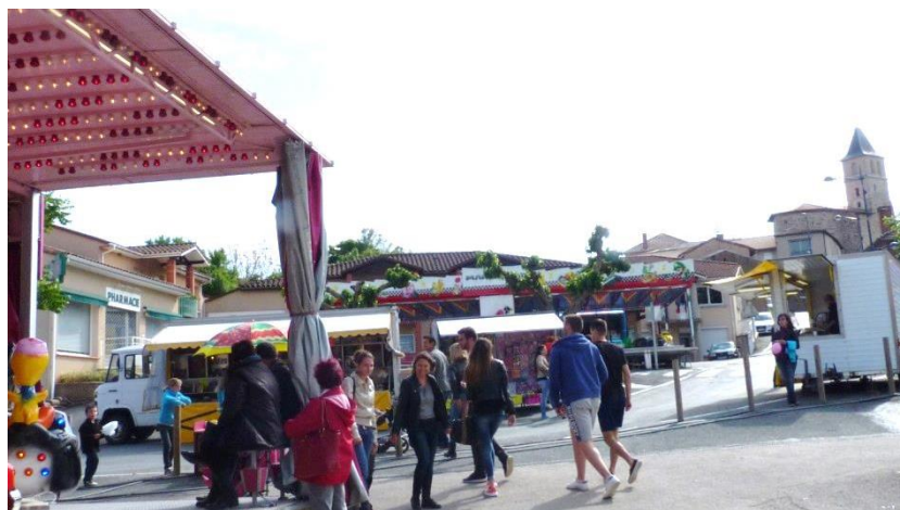
Fête du village