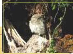
La Chouette chevêche

Taille : 23 à 27,5 cm Poids : 140 à 180 g Envergure : 50 à 57 cm