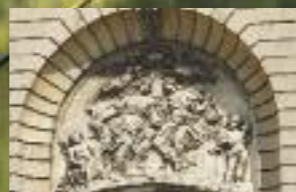
Abbaye de Marchiennes