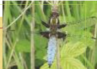
La Libellule déprimée

Taille : 4 à 5 cm de longueur Apparition : de mai à novembre Envergure : 10 cm