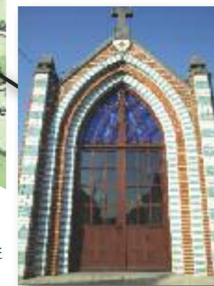
Notre Dame des Affligés - Fenain