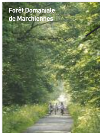
Forêt Domaniale de Marchiennes