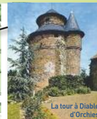
La tour à Diable d'Orchies