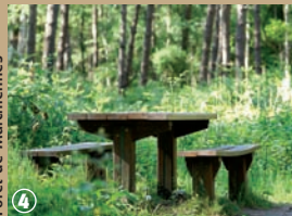
Forêt de Marchiennes

Outre l'aspect botanique, la forêt présente un intérêt biologique par la faune – chevreuils, amphibiens, oiseaux – qui la peuple et architectural grâce à la proximité d'édifices historiques comme le site de l'Abbaye ou les tours, chapelles et fermes alentour.