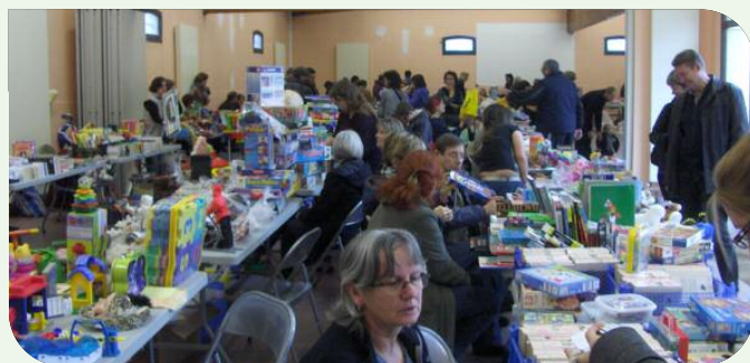
Bourse aux jouets (24 novembre 2013 organisée par la section musique)