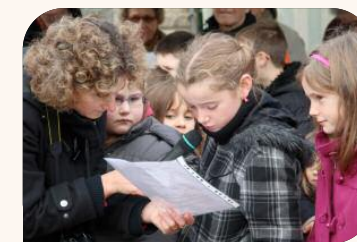
Armistice du 11 novembre

« Montrer aux jeunes que la guerre est une chose horrible et qu'il faut tout faire pour l'éviter. »