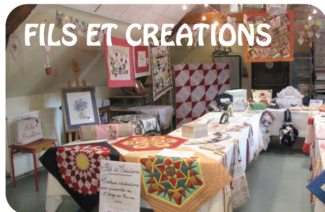
EXPOSITION DANS NOTRE ATELIER.

Pour plus de renseignement appeler au 01 30 95 92 37