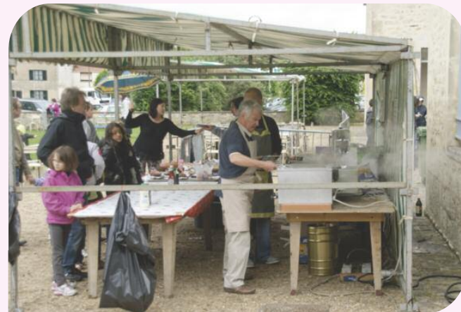
KERMESSE (22 JUIN 2013)