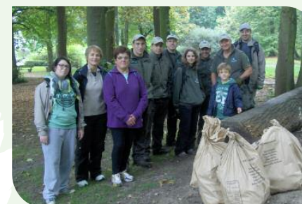
Ramassage de déchets

N'hésitez pas à visiter le site internet www.ecogarde.org et la page Facebook (Dispositif éco-garde). Si l'aventure vous tente, contactez-nous par mail : ecogarde78.sympathisants@gmail.com