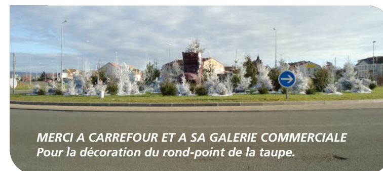
MERCI A CARREFOUR ET A SA GALERIE COMMERCIALE Pour la décoration du rond-point de la taupe.