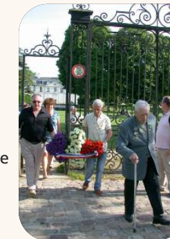
Commemoration 08 mai (victoire 1945)