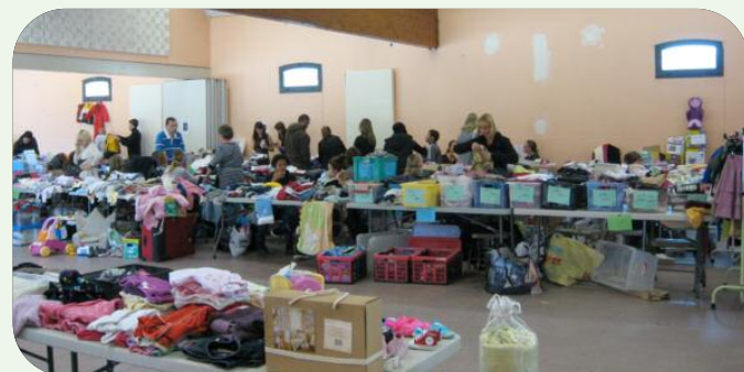
Bourse aux vêtements et puériculture (20 octobre 2013 organisée par la section JUDO)