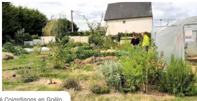
Visite au jardin partagé Cojardinons en Goëlo