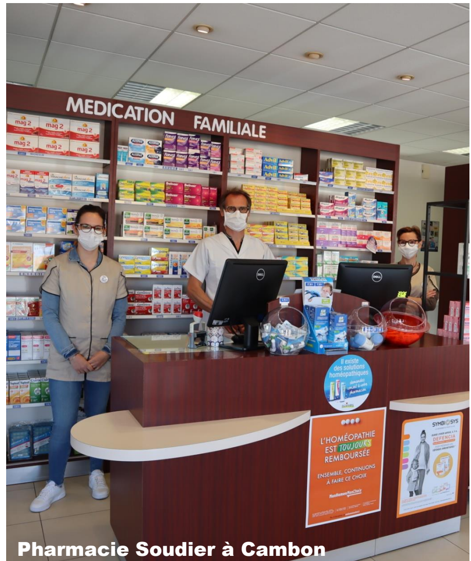
Pharmacie Soudier à Cambon

La collecte sélective (des sacs jaunes) n'est plus assurée depuis le 23 mars.