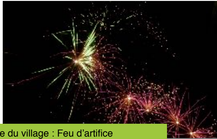
Fête du village : Feu d'artifice