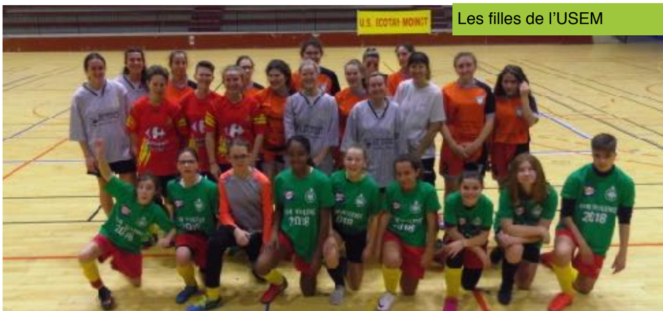
Les filles de l'USEM

Pour les autres évènements de la saison, il faut saluer les beaux succès des traditionnels tournois en salle de janvier (Féminines et U.13) ou février (U.9 et U.11) et du Trophée du Forez (Tournoi U.13 et U.11), devenu un rendez-vous incontournable du mois de mai pour les plus grands clubs ligériens.