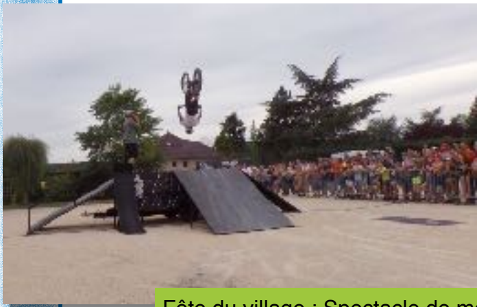
Fête du village : Spectacle de moto