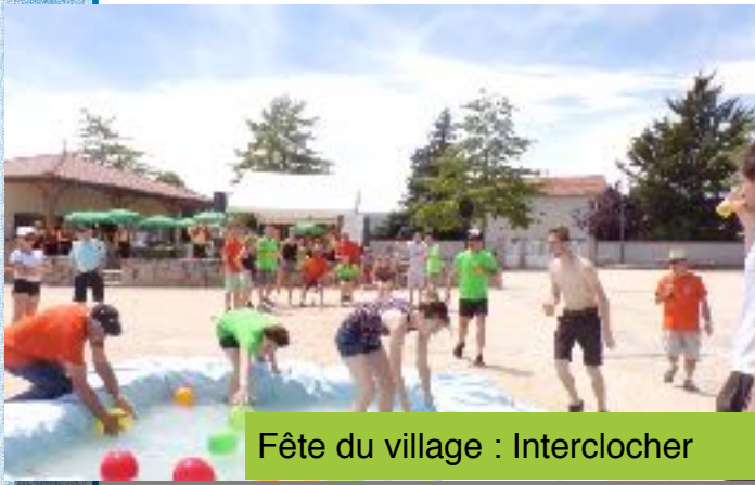
Fête du village : Intercllocher