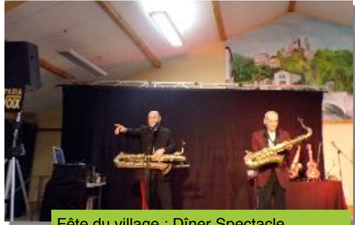
Fête du village : Dîner Spectacle