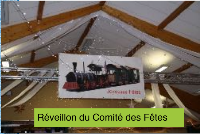
Réveillon du Comité des Fêtes