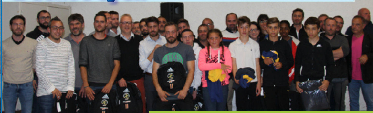
Les éducateurs récompensés