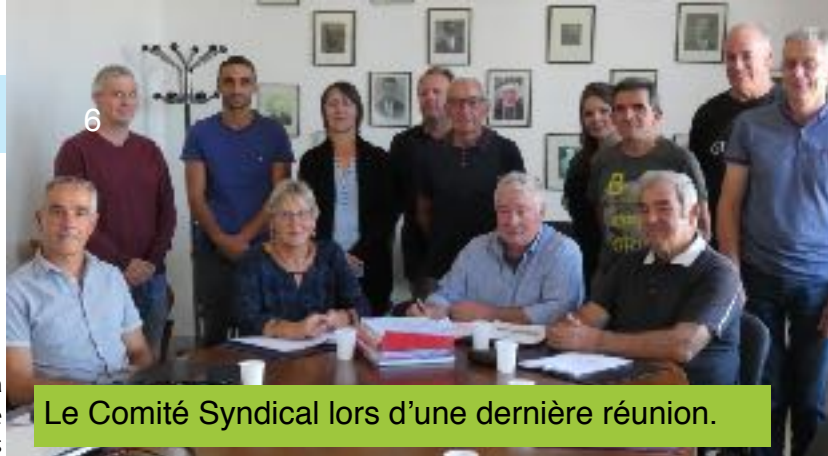
Le Comité Syndical lors d'une dernière réunion.