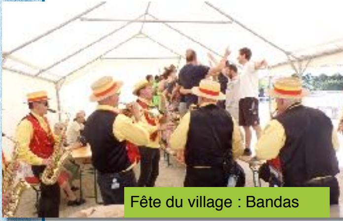
Fête du village : Bandas