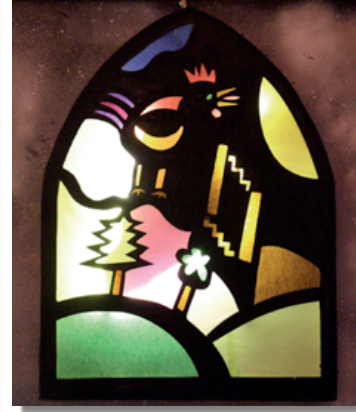
Réveillon du Comité des Fêtes