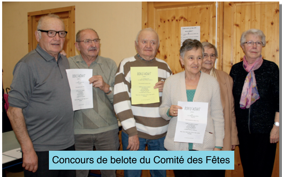
Concours de belote du Comité des Fêtes