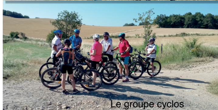
Le groupe cyclos