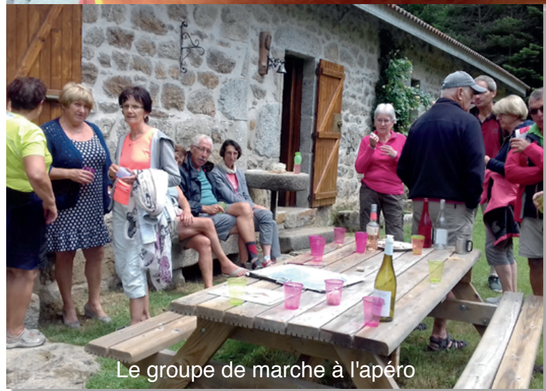
Le groupe de marche à l'apéro