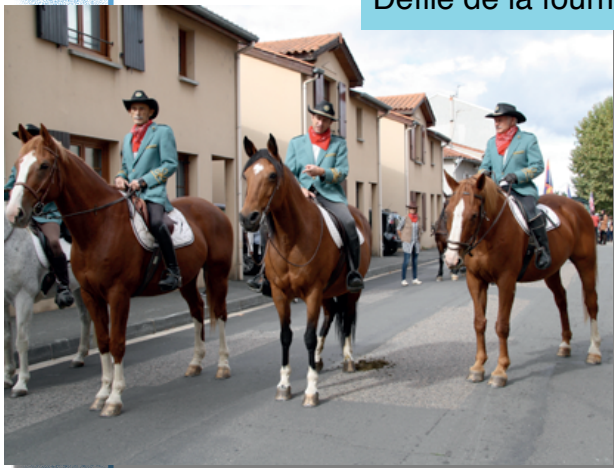
Défilé de la fourme