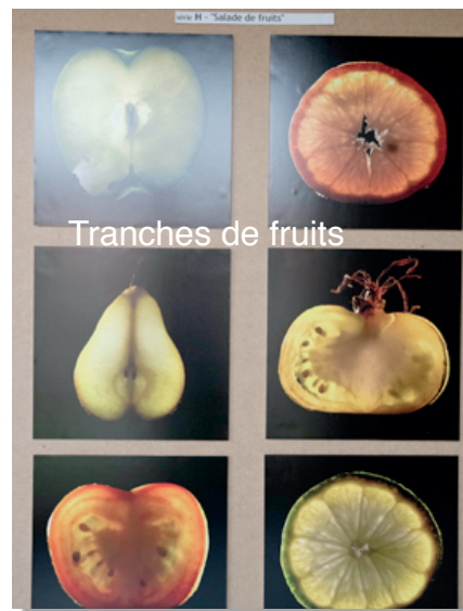
Tranches de fruits

Pour la saison 2018-2019 , nous gardons la même organisation, mais nous ajoutons une séance par mois "spéciale débutant" pour apprendre les différents réglages de son appareil photo. Pour tout renseignement complémentaire contact Edmond DURON 06 72 58 57 82.