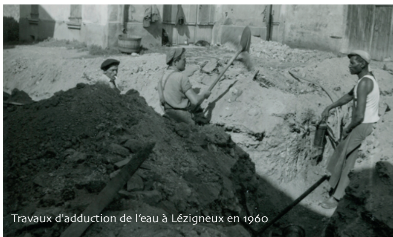
Travaux d'adduction de l'eau à Lézigneux en 1960

Malgré cela l'eau fournie reste à un niveau respectable tant quantitatif que qualitatif et à un tarif uniforme pour tous les abonnés, qui ont pris conscience que l'eau était un bien précieux qu'il ne fallait pas gaspiller . Les chiffres démontrent en effet que si le nombre d'abonnés est en constante augmentation + 30% sur ces 10 dernières années, la consommation annuelle reste sensiblement stable avec 242.800 m 3 d'eau facturée.