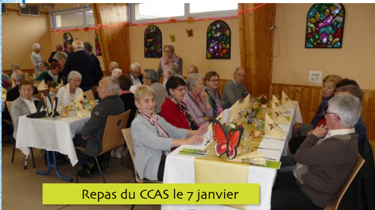
Repas du CCAS le 7 janvier