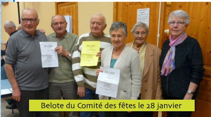
Belote du Comité des fêtes le 28 janvier