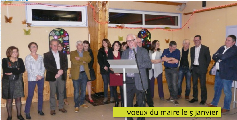
Voeux du maire le 5 janvier