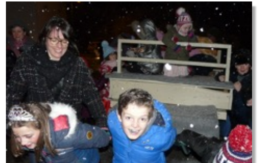
Carnaval de la Keup-On et de la Commission Jeunesse 13 février