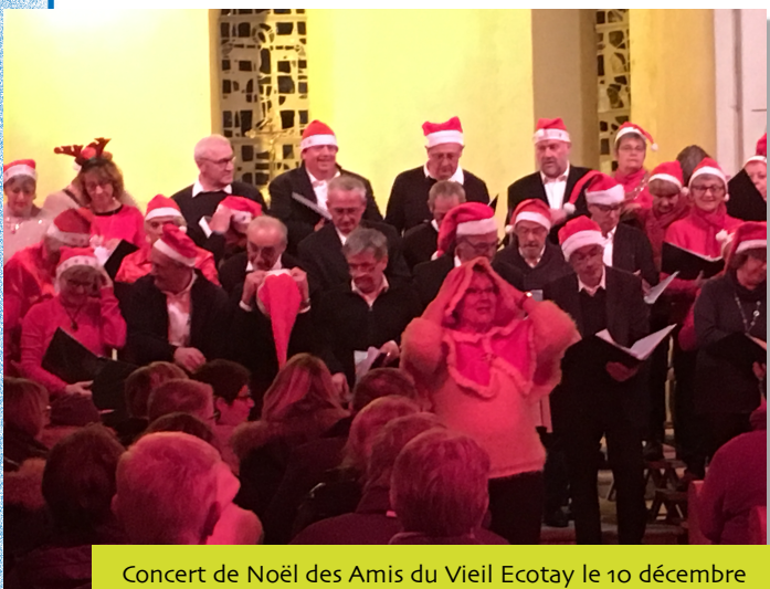
Concert de Noël des Amis du Vieil Ecotay le 10 décembre