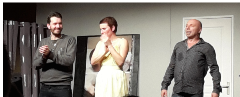
Soirée Théâtre du CCAS 10 mars avec la Cie Les Carrés m'en Fous