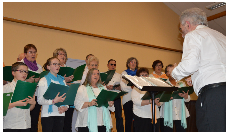
Inter Chorales le 7 avril organisée par la Chorale d'Ecotay