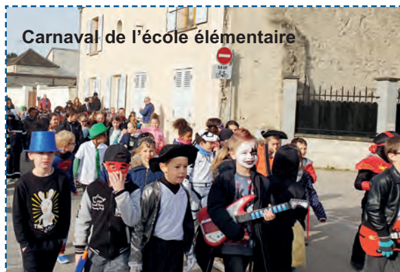
Carnaval de l'école élémentaire