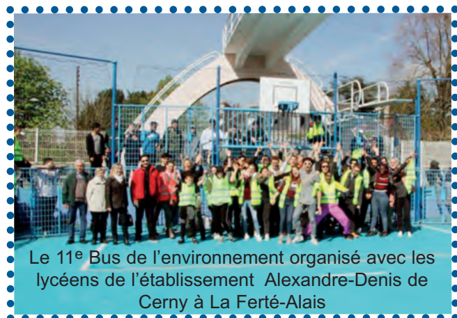
Le 11 e Bus de l'environnement organisé avec les lycéens de l'établissement Alexandre-Denis de Cerny à La Ferté-Alais