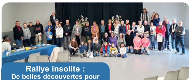
Rallye insolite : De belles découvertes pour tous et une première réussie