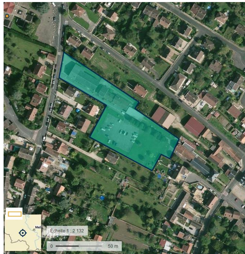
Montage photo aérienne IGN