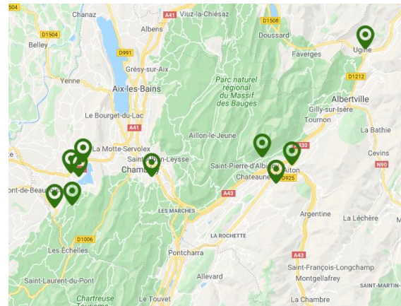
Carte : Nids de frelon asiatique détruits sur le département de la Savoie en 2019

Les conditions climatiques de l'année semblent avoir été défavorables au prédateur. Malgré tout, le frelon asiatique continue sa progression.