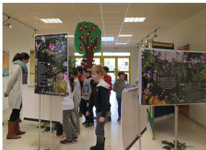
Exposition avec l'APE