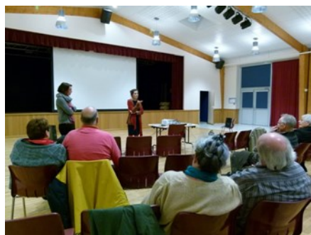
Mois du Documentaire