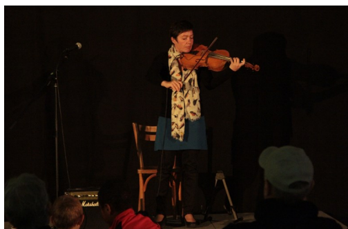
Festival Amies Voix