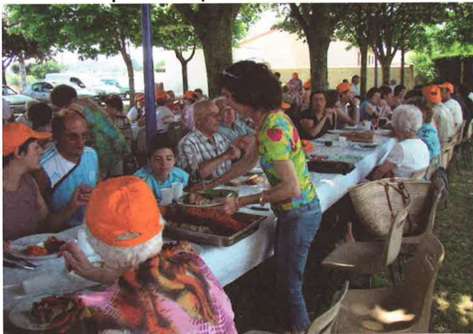
De très nombreux habitants ont répondu présents pour déguster la paella lors du 10 ème anniversaire de la fête du quartier St Jean

Samedi 7 Juin, une trentaine d'habitants des Prés de la Chartreuse, rue Gambetta, se sont retrouvées pour le 4 ème repas de ce quartier. L'incertitude du temps les a obligés à se re-