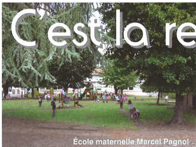
École maternelle Marcel Pagnol