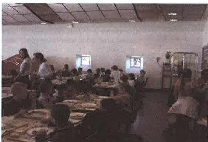
Le restaurant avant les travaux : une seule salle pour les enfants des écoles primaires et maternelles.

permettant notamment d'aménager une nouvelle salle de restauration de 90 m 2 . Une telle extension s'imposait eu égard à la forte progression de la fréquentation de ce service qui a quasiment doublé en 10 ans. Désormais, les enfants bénéficient de locaux plus spacieux permettant une séparation des élèves des écoles primaires et maternelles, afin d'améliorer le confort de chacun.