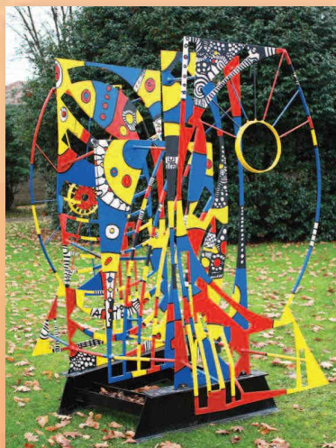
« Couleurs en suspens »

* Ciel écran - VTHR (Vidéo Transmission en Haute Résolution) : spectacles diffusés sur grand écran.