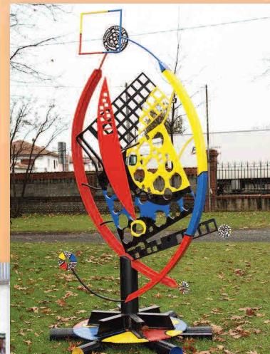
« La lune à sa fenêtre »