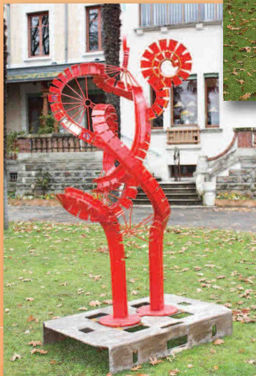
« Petite spirale rouge »