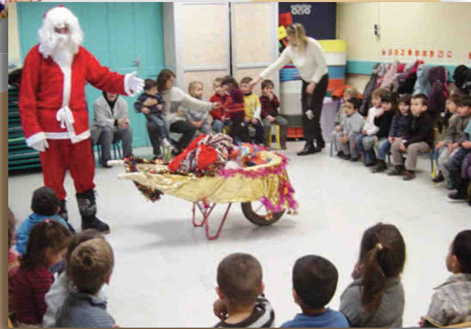
Ecole Marcel Pagnol