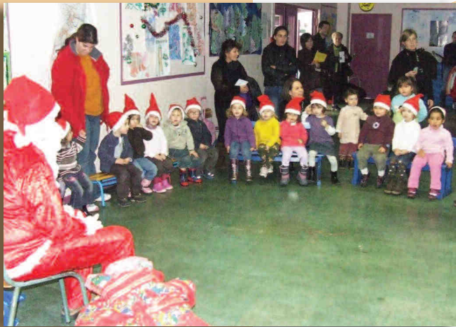
Ecole maternelle des Cèdres

Avec quelques jours d'avance, le Père Noël a visité les deux écoles maternelles de la Commune pour livrer aux enfants des cadeaux. Il a été accueilli comme il se doit, par des chants et des dessins. Cette réception s'est clôturée par le traditionnel goûter.