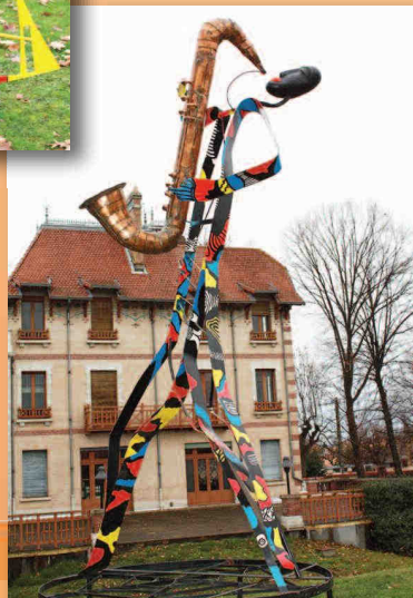
« Le saxophoniste »