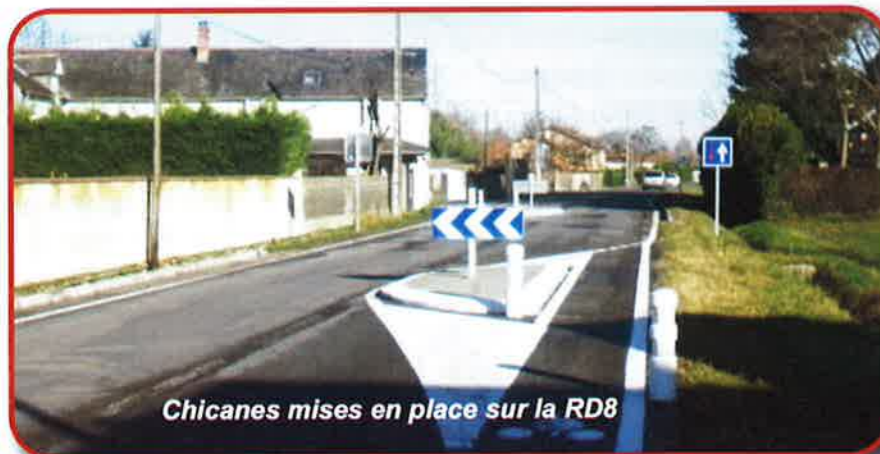
Chicanes mises en place sur la RD8

Plus généralement, la sécurité routière demeure une préoccupation majeure de la Municipalité. Des aménagements routiers sont réalisés ou à l'étude afin de sécuriser certains axes. Ainsi, en partenariat avec le Conseil Général, des chicanes ont été mises en place sur la partie nord de la rue du XI Novembre (travaux réalisés et financés par le Conseil Général), permettant de réduire la vitesse des automobilistes entrant dans la ville. Concomitamment à la réalisation de cet aménagement, l'entrée de l'agglomération a été déplacée jusqu'à la limite de l'urbanisation, de manière à étendre la zone limitée à 50 km/h, et la vitesse autorisée entre AUREILHAN et BOURS a été réduite à 70km/h.