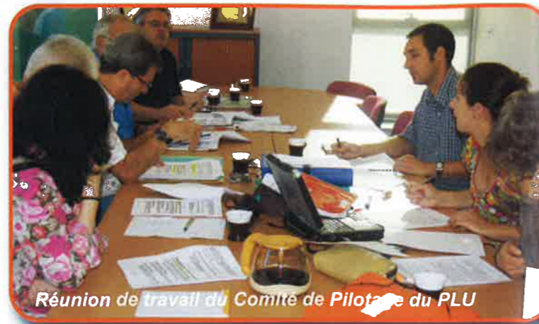
Réunion de travail du Comité de Pilotage du PLU

Le Projet d'Aménagement et de Développement Durable (PADD) , qui exprime clairement les grands axes de la politique d'urbanisme et d'aménagement que la Commune souhaite inscrire sur son territoire, a été approuvé par le Conseil Municipal.