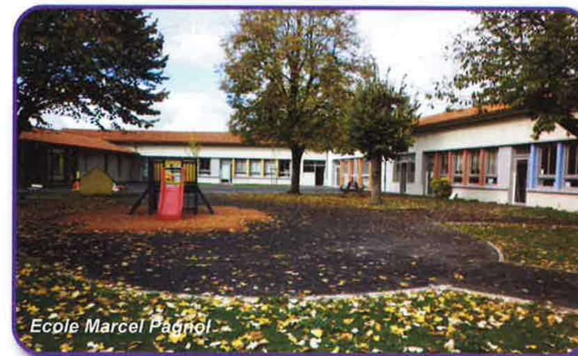
Ecole Marcel Pagnol

En 2010, l'école primaire Joliot-Curie a été entièrement rénovée. En outre, 8 nouveaux sanitaires (dont 2 pour personnes à mobilité réduite), ont été aménagés sous le préau.