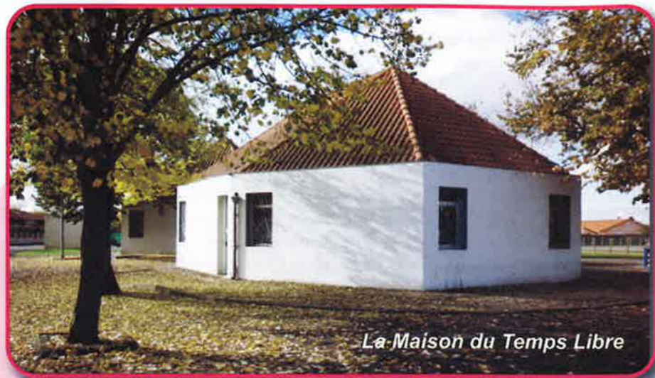
La Maison du Temps Libre