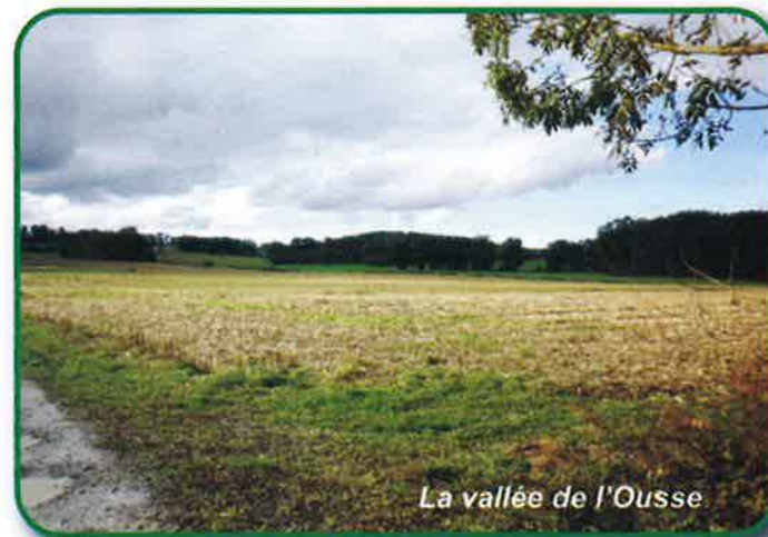
La vallée de l'Ousse

En 2008, nous avons pris l'engagement de... ...réaffirmer notre opposition au projet de barrage de l'Ousse. Ce dossier, réactualisé par l'Institution Adour en 2007, cristallise une très vive opposition tant politique que citoyenne. Tous les groupes du Conseil Municipal d'AUREILHAN sont CONTRE, tous les Conseils Municipaux du canton sont CONTRE, le Conseiller Général du Canton et Député de la circonscription est CONTRE, le Grand Tarbes, toutes tendances politiques confondues, est CONTRE, les associations départementales écologistes et altermondialistes sont CONTRE, l'Association AÏDOT pour la Défense de l'Ousse et de son territoire a repris son activité et est CONTRE.