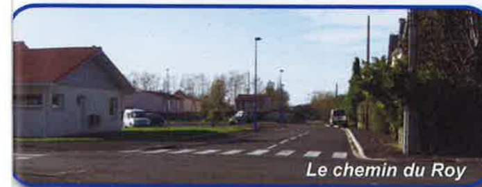
Le chemin du Roy

De plus, à la demande des riverains, une partie du Chemin du Roy a été mise en sens unique pour améliorer la sécurité.