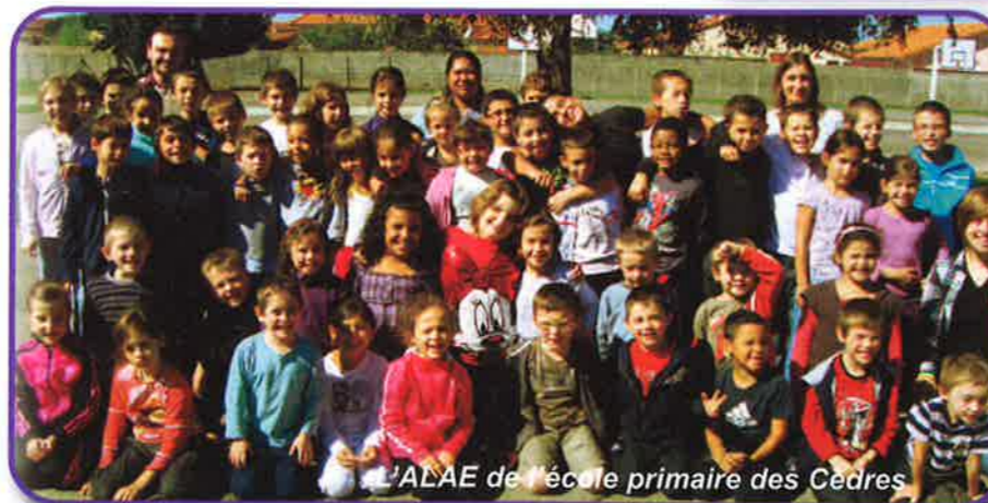
L'ALAE de l'école primaire des Cèdres

Les efforts de la Municipalité se sont également tournés vers l'accueil des enfants. Aujourd'hui, les Accueils de Loisirs Sans Hébergement (ALSH) sont organisés pour toutes les tranches d'âges (3/6 ans, 6/12 ans, 11/14 ans et 14/17 ans) afin de répondre au mieux aux besoins des enfants et des familles. Un Accueil de Loisirs Associé à l'Ecole (ALAE) a été mis en place dans les écoles primaires et propose aux élèves des activités, assurées par les animateurs qualifiés de la Maison des Jeunes et de la Culture, pendant la pause méridienne et les garderies du matin et du soir.