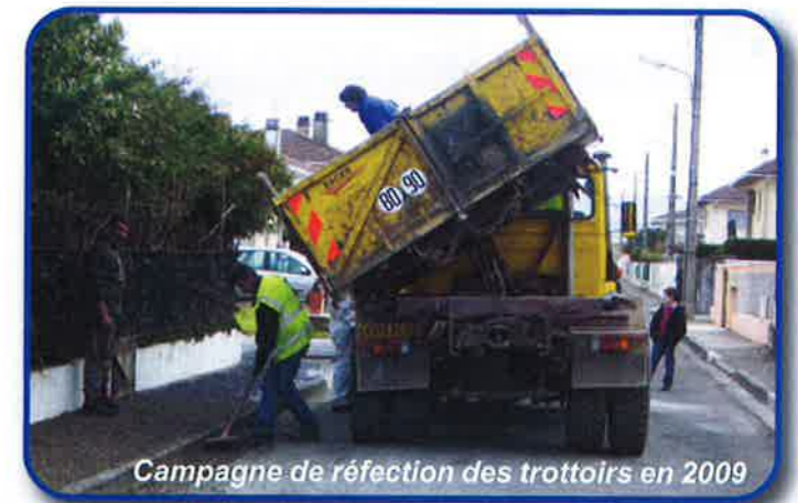
Campagne de réfection des trottoirs en 2009

- la restructuration et l'embellissement du quartier du Bout Pont dans le cadre d'une Opération de Renouvellement Urbain (réhabilitation de la placette commune aux deux villes d'AUREILHAN et de SEMEAC, aménagement de la partie Sud de l'avenue des Sports, de la rue Emile Salles et de l'avenue Jean Jaurès).