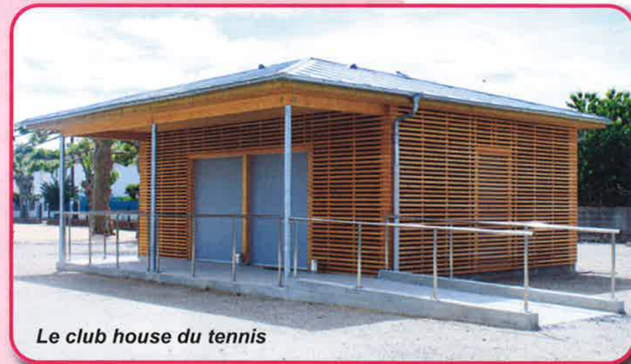
Le club house du tennis