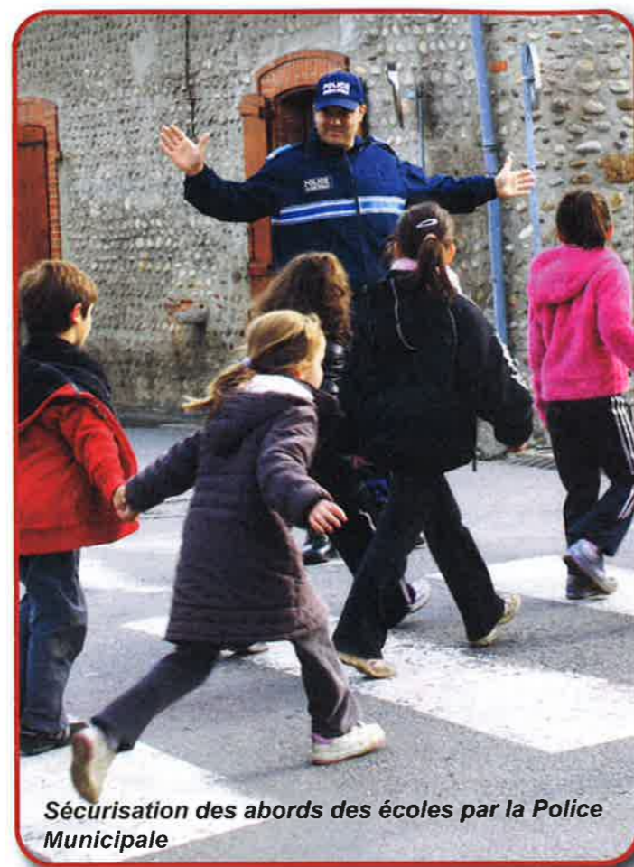
Sécurisation des abords des écoles par la Police Municipale

3) La tenue d'une permanence hebdomadaire (tous les mercredis après-midi de 14h30 à 17h30) par un fonctionnaire de police, dans un bureau de la Mairie. Ce policier assure un point de contact pour les opérations « tranquillité vacances » et « tranquillité seniors » et reçoit les mentions « mains courantes » ainsi que les plaintes qui ne présentent pas de difficultés particulières.