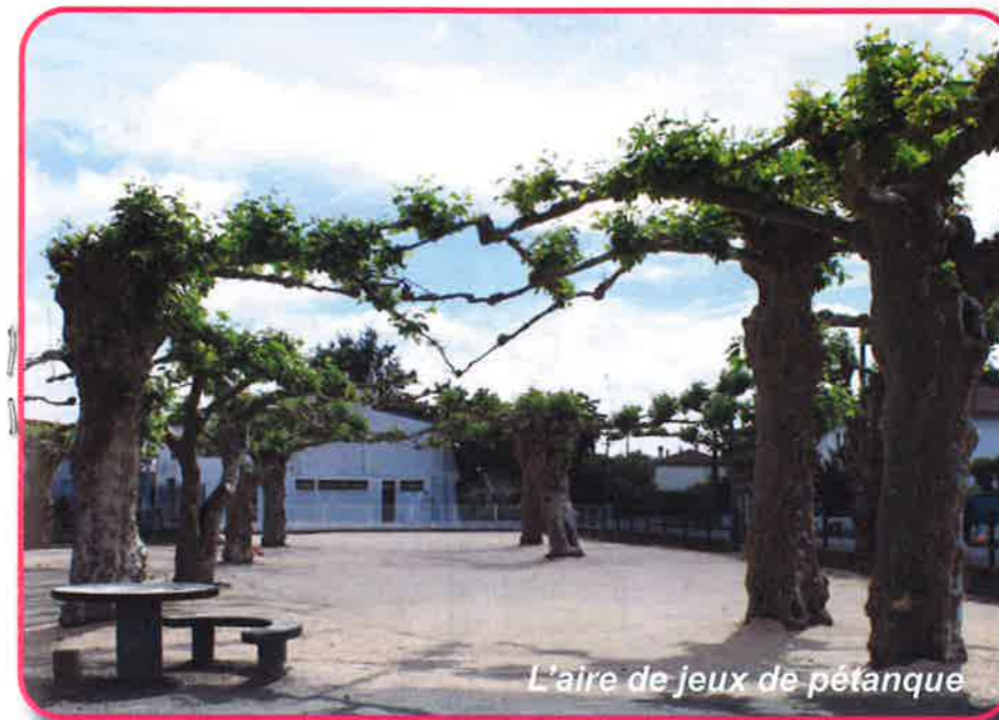
L'aire de jeux de pétanque