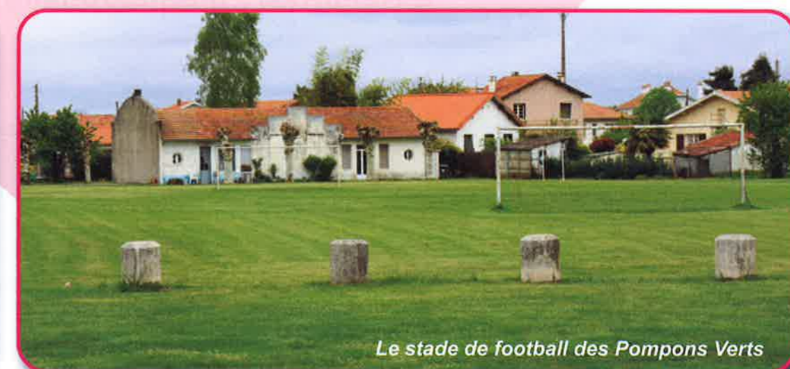
Le stade de football des Pompons Verts