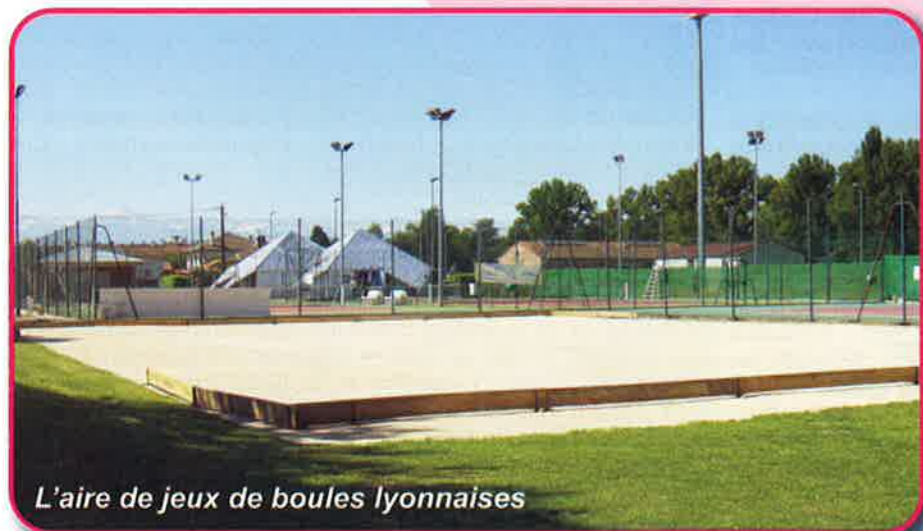
L'aire de jeux de boules lyonnaises

La Commune fournit un effort important pour l'entretien des espaces sportifs. Ainsi, le gazon des trois terrains du Parc des Sports, du stade des Pompons Verts et du stade Jules Ferry sont régulièrement aérés, tondu et amendés en engrais. En outre, la Commune a fait l'acquisition d'un tracteur (en 2009) pour le nettoyage quotidien du Parc des Sports et de ses abords (ramassage des déchets et des feuilles).