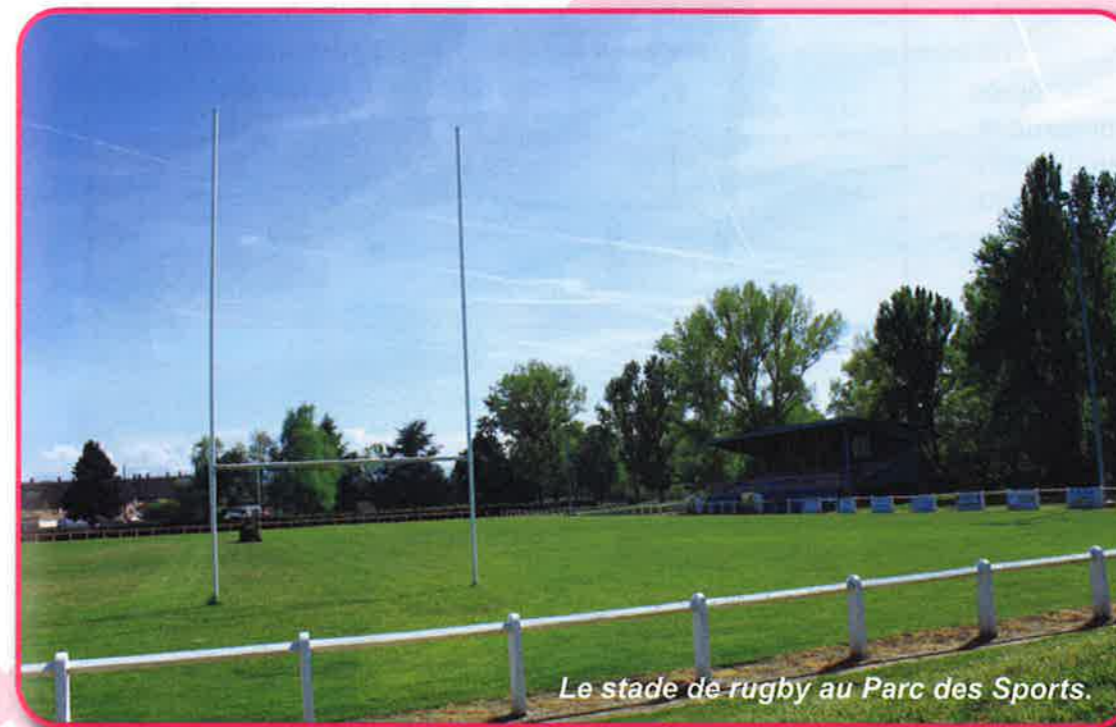
Le stade de rugby au Parc des Sports.

La Commune fournit un effort important pour l'entretien des espaces sportifs. Ainsi, le gazon des trois terrains du Parc des Sports, du stade des Pompons Verts et du stade Jules Ferry sont régulièrement aérés, tondu et amendés en engrais. En outre, la Commune a fait l'acquisition d'un tracteur (en 2009) pour le nettoyage quotidien du Parc des Sports et de ses abords (ramassage des déchets et des feuilles).