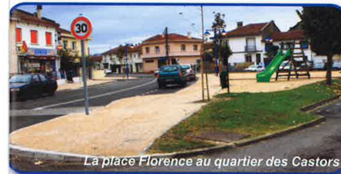
La place Florence au quartier des Castors

L'aménagement du Chemin des Alouettes - Création de deux trottoirs, suffisamment larges pour être accessibles aux personnes à mobilité réduite, - Renforcement du réseau pluvial pour résoudre l'écoulement des eaux ; - Réfection de la voirie par le renouvellement de la couche de roulement ; - Mise en sécurité de la sortie sur la rue du XI Novembre.