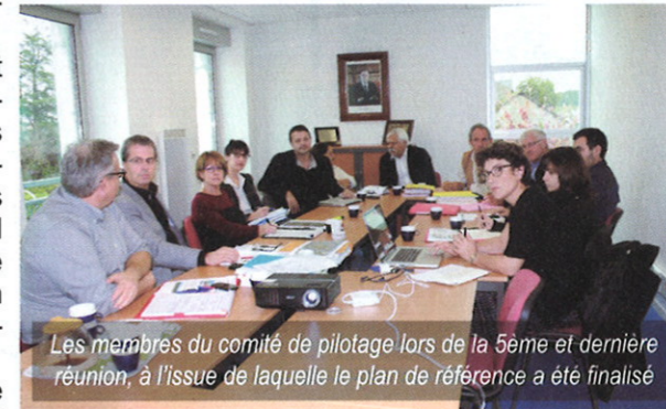
Les membres du comité de pilotage lors de la 5ème et dernière réunion, à l'issue de laquelle le plan de référence a été finalisé

Il reste désormais à déterminer l'outil qui permettra de dérouler ce projet pour Aureilhan.