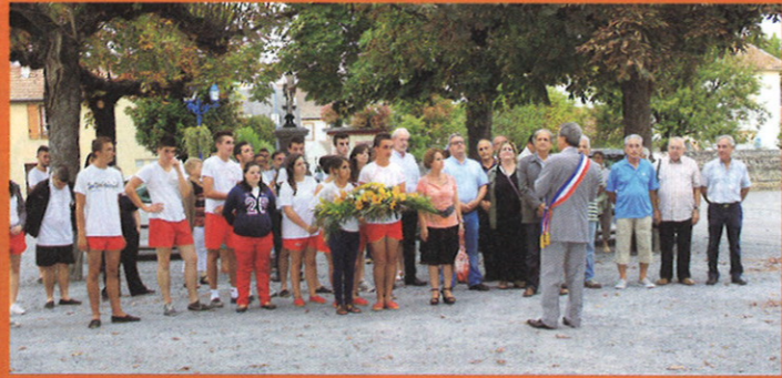
Fête locale : Ouverture de la fête locale, le 27 septembre dernier, avec le dépôt d'une gerbe par les Conscrits et l'apéritif offert par la Municipalité.