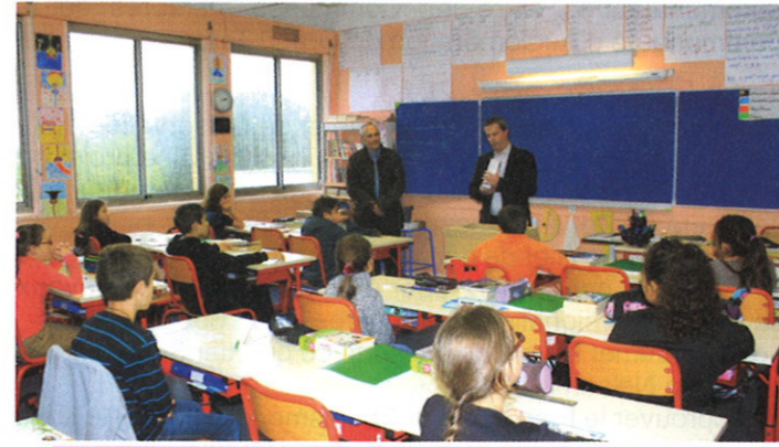
Ci-contre : dans la classe de CM2 de l'école élémentaire des Cèdres.