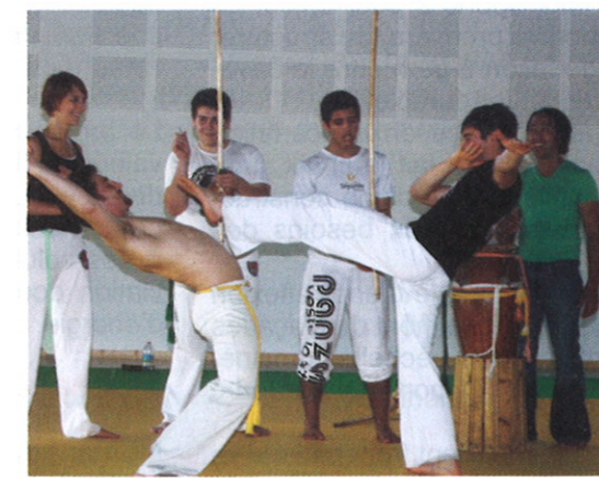
Le matin, lors de la visite des installations, ou l'après-midi, à l'occasion de la journée portes ouvertes, les sections Basket, Capoeira, et Judo de l'ASCA ont pu effectuer des démonstrations de leur sport.