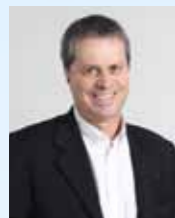
Yannick BOUBÉE Maire