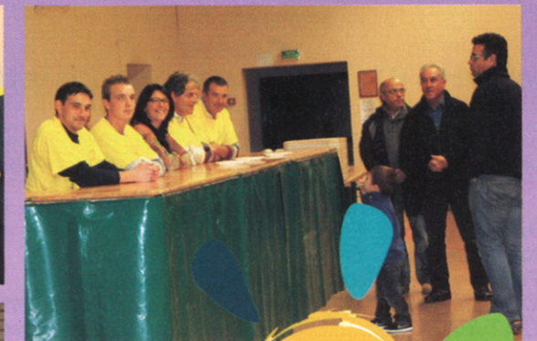
Le Personnel Communal qui fut très présent durant cette manifestation.

A vous tous, nous souhaitons une bonne et heureuse année.