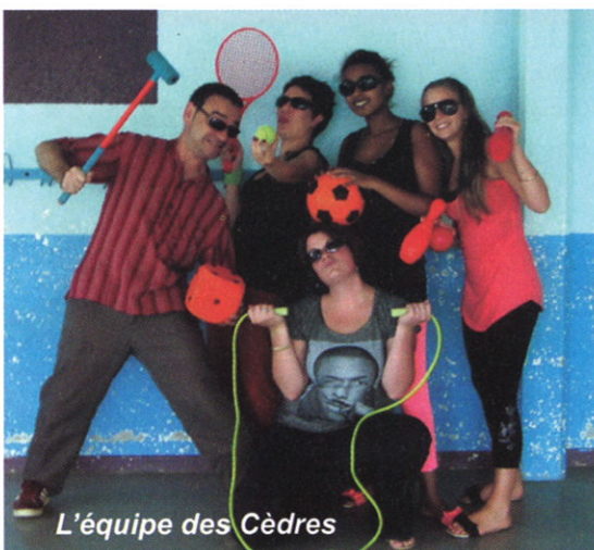
L'équipe des Cèdres

Le groupe de travail constitué se réunit une fois par trimestre pour assurer le suivi de cette réforme. Au terme de l'année scolaire, un bilan sera dressé pour améliorer le fonctionnement aujourd'hui encore perfectible.