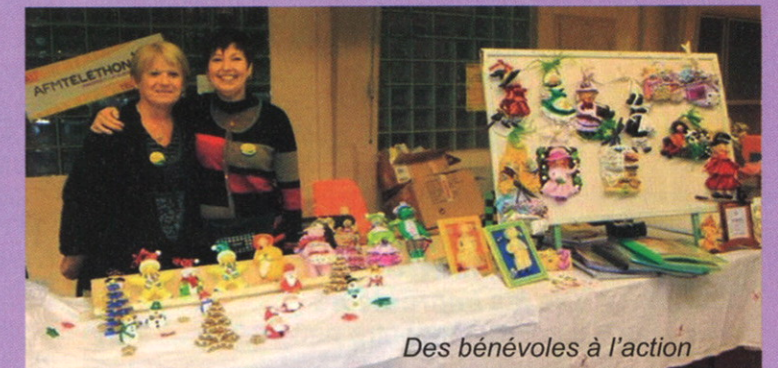
Des bénévoles à l'action