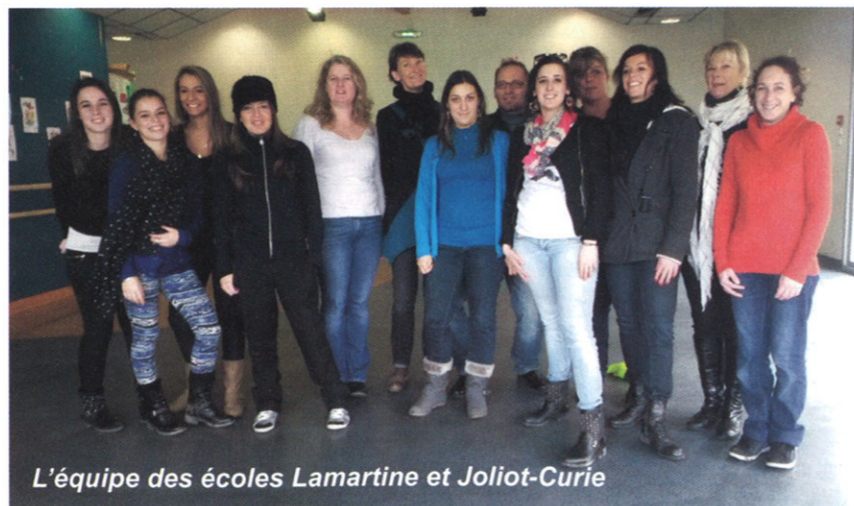
L'équipe des écoles Lamartine et Joliot-Curie