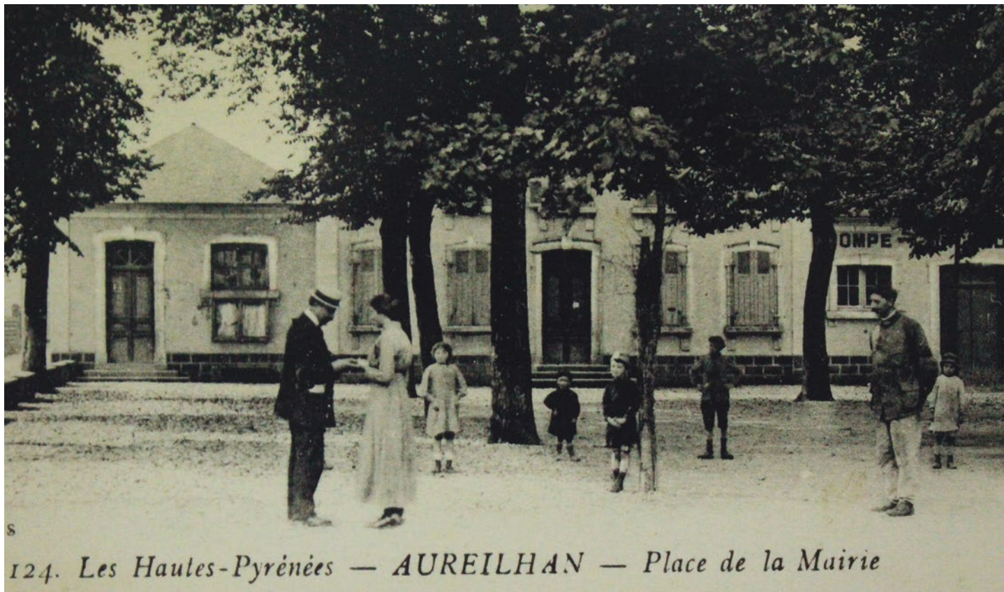
Vue de la Mairie entre 1900 et 1910