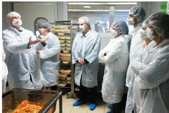
Respectant les normes d'hygiène, les cuisines ne sont accessibles qu'aux personnes revêtues des protections adéquates (blouse, filet, masque).

Parce qu'une administration au plus près des attentes de ses usagers, c'est une administration qui fait progresser le service public.