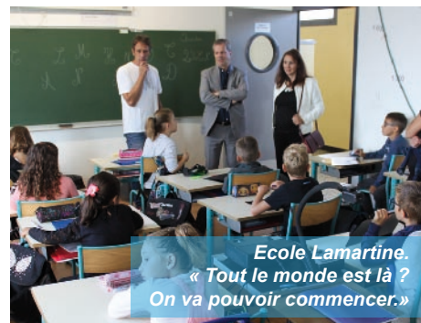
Ecole Lamartine. « Tout le monde est là ? On va pouvoir commencer. »