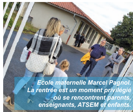
Ecole maternelle Marcel Pagnol. La rentrée est un moment privilégié où se rencontrent parents, enseignants, ATSEM et enfants.

La scolarisation des moins de trois ans nécessite des classes adaptées à la pédagogie à mettre en œuvre en direction de ces enfants (tables à langer, modules de motricité, jeux...). Pour accueillir ce public spécifique, des modules de formation ont été dispensés par les services de l'Education Nationale aux enseignants, aux ATSEM et aux personnels périscolaires. Le succès est au rendez-vous (plus de 40 enfants inscrits !), confirmant la satisfaction d'un besoin exprimé par les familles.