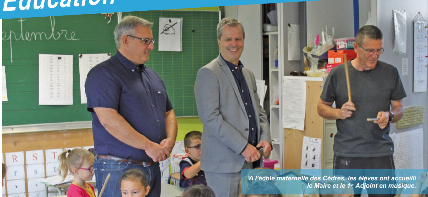
A l'école maternelle des Cèdres, les élèves ont accueilli le Maire et le 1 er Adjoint en musique.