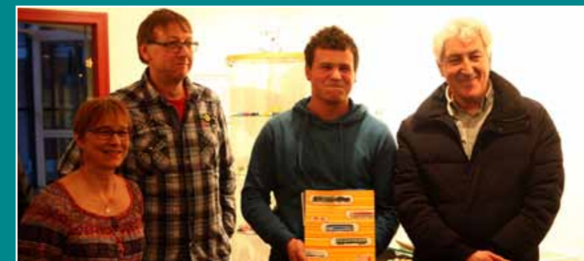
Les trois collectionneurs de 2016 et leurs collections respectives (les trains Jouef, les autocollants publicitaires et les gommages)