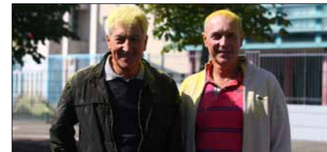
Le maire et son adjoint, véritablement colorés !

Les animations été 2017 ont connu à nouveau un joli succès : elles ont rassemblé 180 jeunes de 5 à 18 ans répartis de la manière suivante : 185 inscriptions dans les stages d'une semaine encadrés en tout par 25 animateurs des associations et 205 inscriptions dans les sorties variées. Les plus demandées ont été la « Vie des Pompiers » avec 17 inscrits, le « Village des Cowboys » chez les Westerners, 15 inscrits, et le karting avec 12 inscrits. Des remerciements tout particuliers sont à adresser aux présidents des nombreuses associations sportives et culturelles qui se sont investis dans ces différentes activités. Depuis des années, ils répondent présent et mettent à disposition l'encadrement qualifié nécessaire malgré leur saison sportive déjà bien remplie.