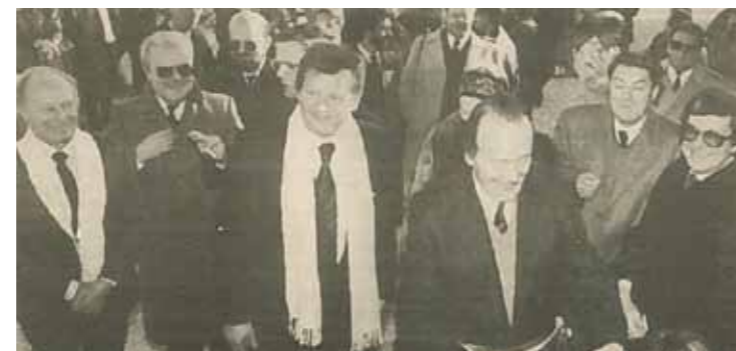
Les personnalités ont coupé le ruban symbolique avant d'admirer les travaux d'agrandissement et de rénovation de cette école fréquentée par 110 élèves.