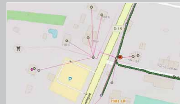
Ci-dessus un plan représentant l'armoire NRO qui dessert l'armoire PM et celle-ci qui dessert à son tour les points de branchements pour amener le service aux abonnés sur la commune de Wittelsheim