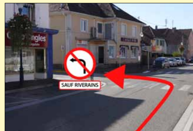
Fermeture de la place de la mairie et implantation du bâtiment provisoire du Crédit Mutuel

Retrouvez les nouveaux sens de circulation en vidéo sur Facebook ou sur wittelsheim.fr