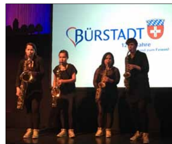
Soirée de clôture à Bürstadt, la musique en prime !