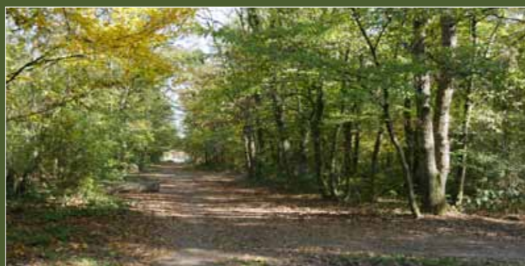
Site du futur lotissement Peguy, derrière la salle Grassefert

Envie d'en savoir davantage, contact au service de l'Aménagement du Territoire au 03 89 57 88 31 pour obtenir les coordonnées des différents promoteurs et les modalités de réservations.