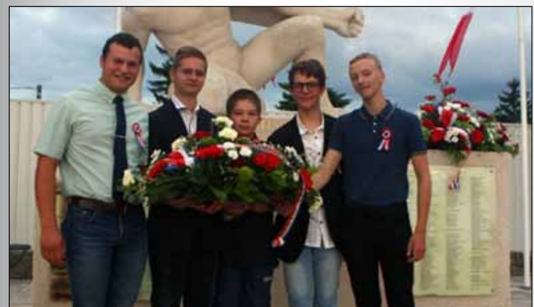
Quelques membres du CCJ lors de la cérémonie du 14 juillet 2017

Le CCJ précise enfin qu'il « tenait à remercier la municipalité de son soutien indéfectible envers la jeunesse ! »