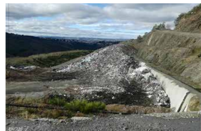
Alvéole n°4 : Décembre 2018

Au regard des investissements disproportionnés par rapport à la durée d'exploitation, le SICTOM a donc dû envisager une alternative pour le traitement de ses ordures ménagères. Suite à l'appel d'offre lancé à l'automne 2018, l'entreprise ALTRIOM a été retenue pour le traitement des Ordures Ménagères et l'entreprise VACHER pour le transport.