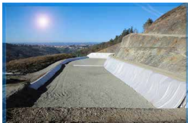
Alvéole n°4 : Mise en service au 1 er janvier 2016

Depuis sa création le SICTOM Velay Pilat enfouit les ordures ménagères des 24 communes de son territoire à Saint-Just Malmont dans un site de stockage dédié et entièrement géré par la collectivité.