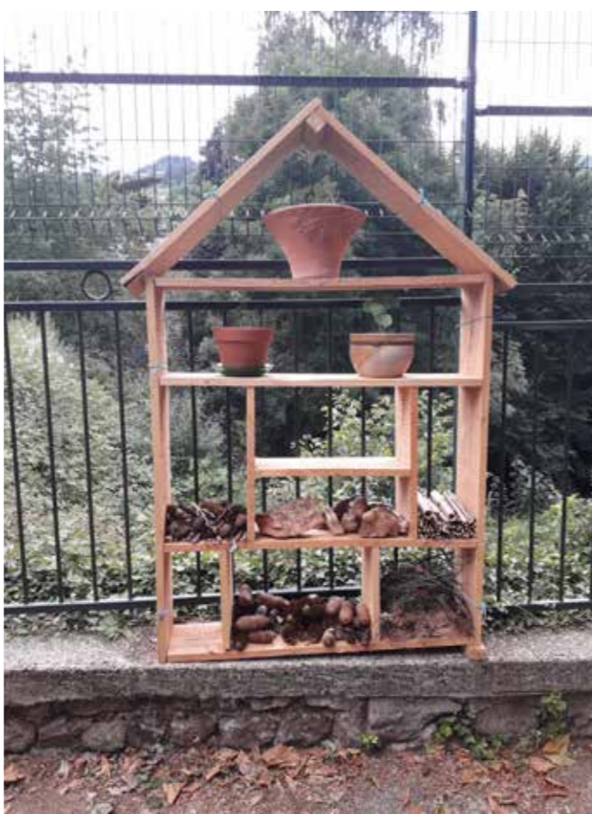
L'hôtel à insectes a pris place à l'école privée.