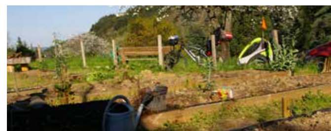
Poursuite du jardin des Matrus pour les habitants du village.

publics, la requalification des voies d'accès, le stationnement, l'implication des habitants sur leur cadre de vie.