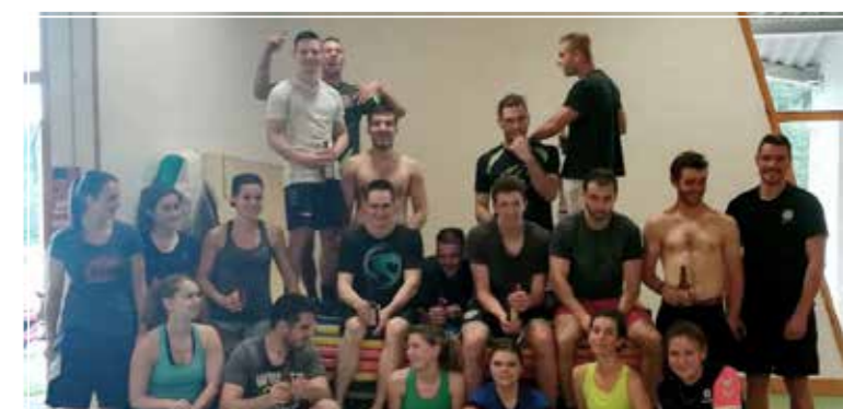
La section musculation / fitness en plein effort !