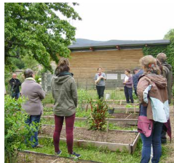
L'atelier zéro-phyto a eu lieu en Mai 2018.

Ce projet s'inscrit dans le projet global « Aménagements et Urbanisme » de notre Commune sur l'amélioration des espaces