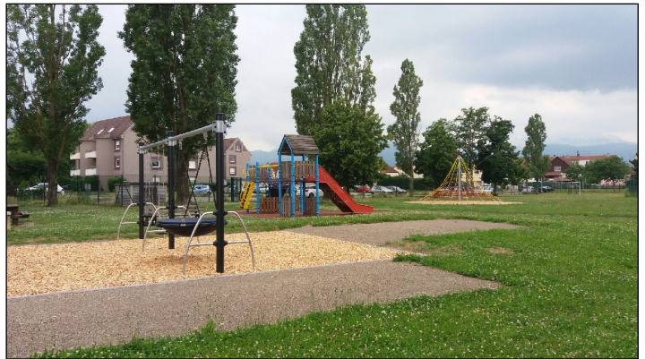
Les balançoires, le tobogan, l'araignée tout au fond