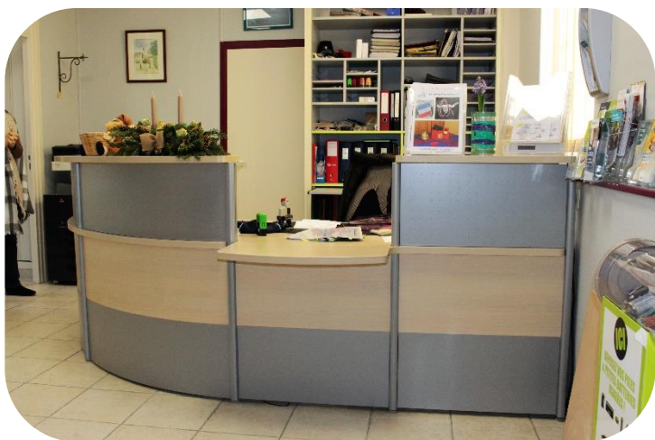
Nouveau bureau d'accueil à la mairie intégrant un espace accessible aux personnes à mobilité réduite