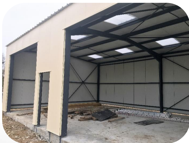
Agrandissement des locaux techniques