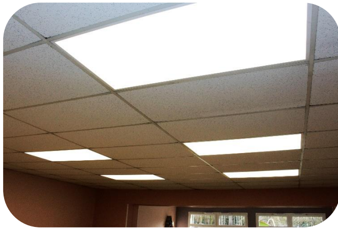
Changement des lumières dans les locaux communaux