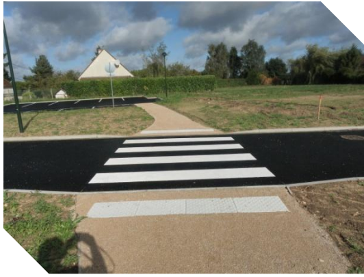
Lotissement Clos La Grange.