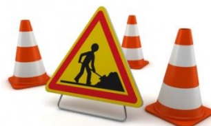
Enfouissement des réseaux et nouveaux candélabres, rue Roger Ollivier.