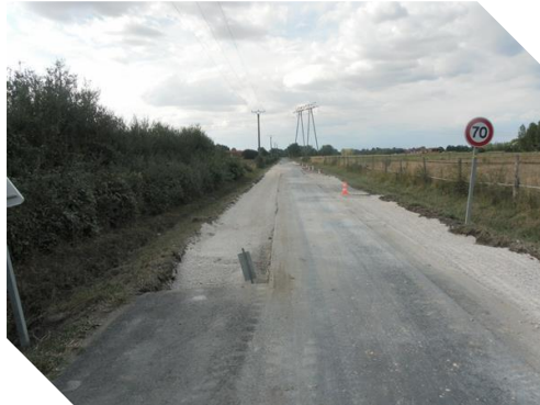
Réfection Route de Meung-sur-Loire.