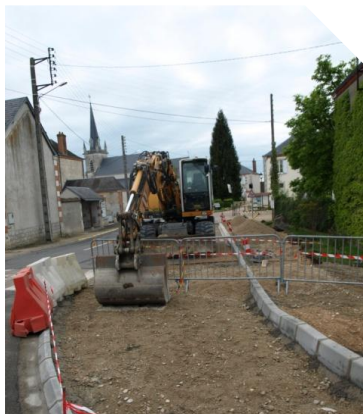
Abri-voyageurs à la Mairie et trottoirs.