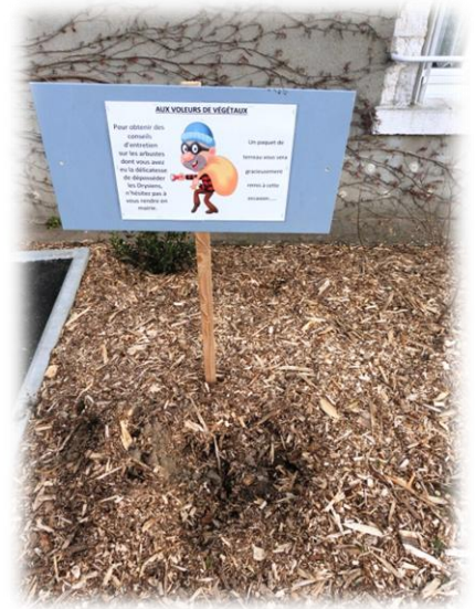
Vol de végétaux