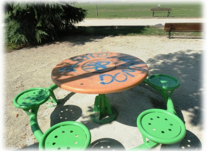
Graffitis sur les tables de la zone de loisirs.