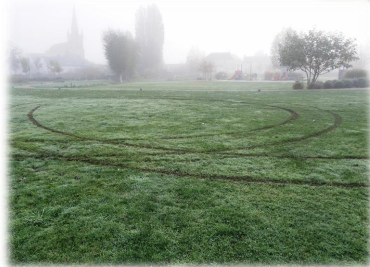
Rodéo sauvage sur la zone de Loisirs.