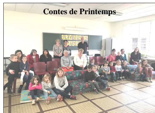
Contes de Printemps